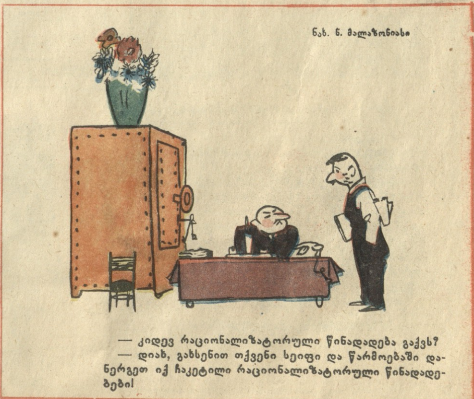
ნახ. ნ. მაღაზონიასი

— კიდევ რაციონალიზატორული წინადადება გაქვს? — დიახ, გახსენით თქვენი სეიფი და წარმოებაში დანერგეთ იქ ჩაკეტილი რაციონალიზატორული წინადადებები!