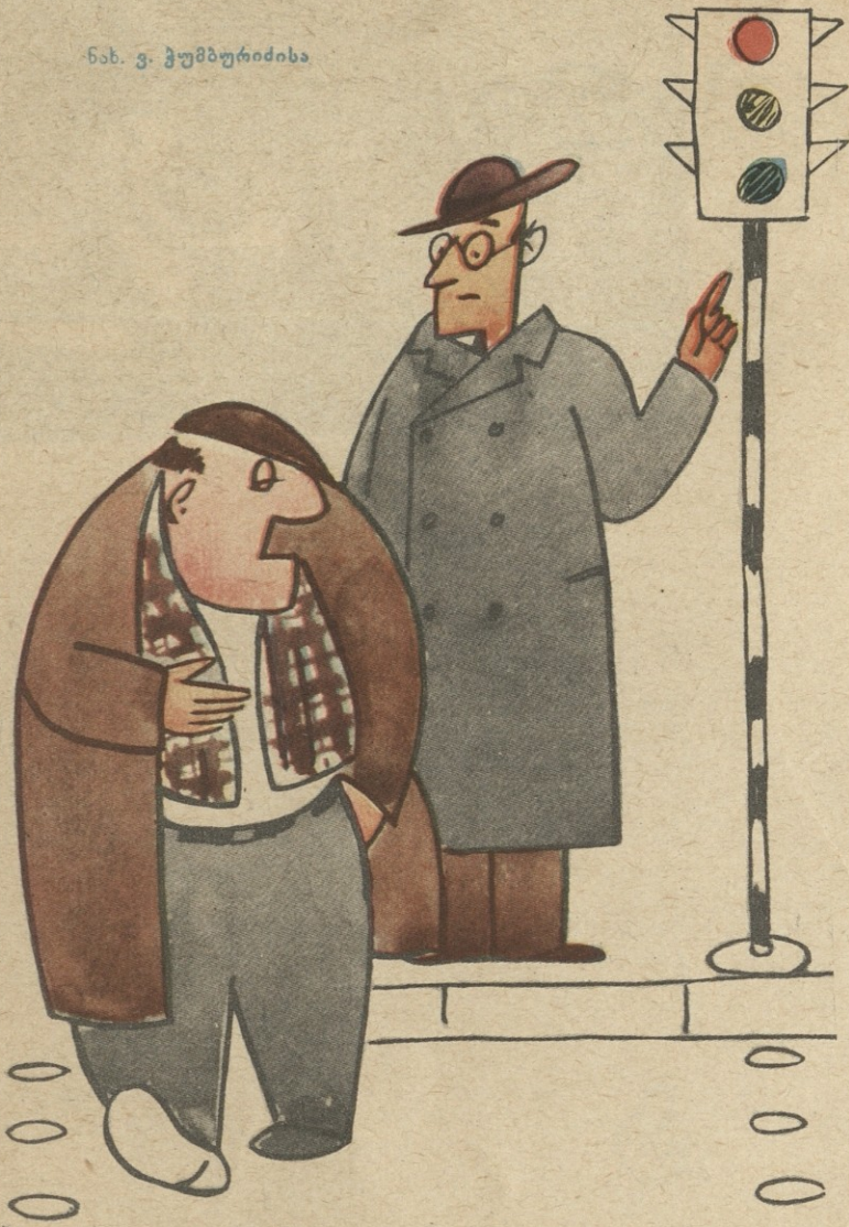
— მოქალაქე. თქვენ წითელზე გადადიხართ! — არა. ჭერ ისევ თეთრ ღვინოს ვსვამ!