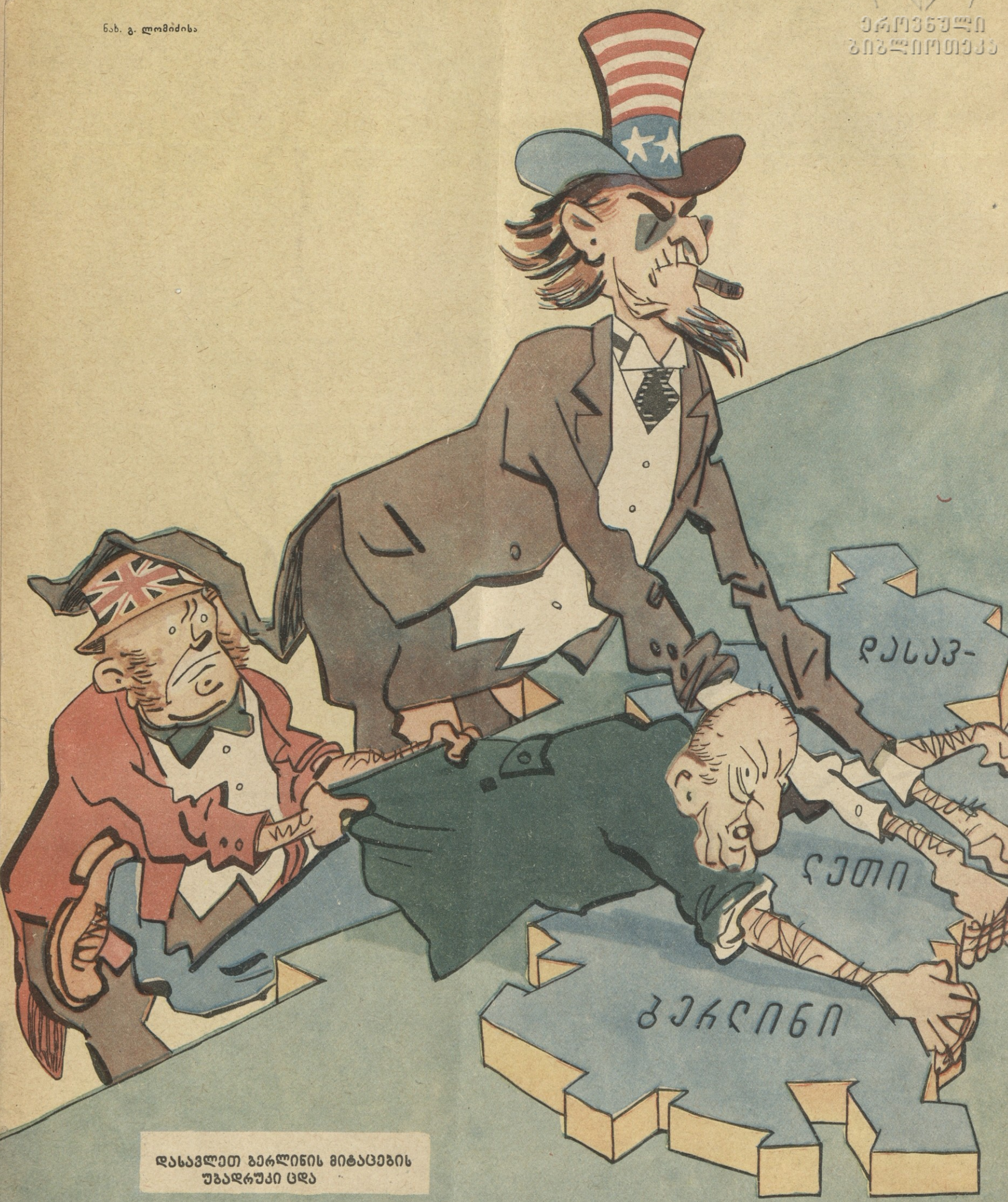
დასავლეთ ბერძენს მიმართვის უპარკუპი ცდა