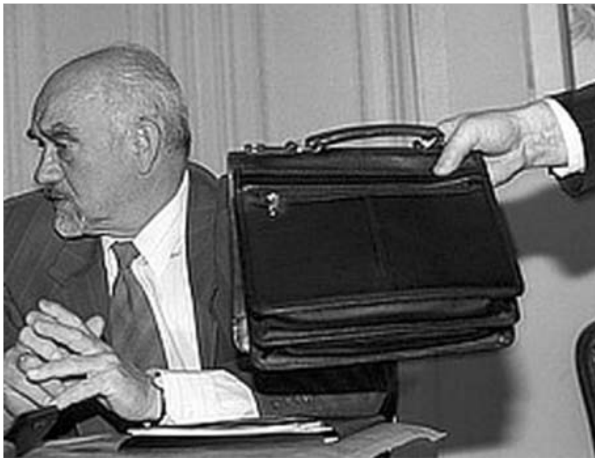
იგორ სმიჩნოვი, დენსტრისპირეთის თვითგამოცხადებული რესპუბლიკის პრეზიდენტი.

რა ც შეეხება უკრაინის დამოკიდებულებას, როგორც პრემიერ-მინისტრმა იური ეხანუროვმა აღნიშნა, ოფიციალური კვიცი არაღიარებული რესპუბლიკის ტერიტორიის უფრო შეტყობინება არაა. 3 მარტიდან უკრაინა თავის საზღვარზე დენსტრისპირეთის მხრივ იმ საქონელს ატარებს, რომელიც მოლდოვის საზღვარსა და საზღვრის მიერაა გაფორმებული. ამის გამო, დენსტრისპირეთის ის სანაშობები, რომლებსაც თავისი პროდუქცია საზღვარგარეთ გააქვთ, იძულებული ხდებიან მოლდოვის ბიუჯეტში დაახლოებით 150 მილიონი აშშ დოლარის ოდენობის გადასახადები შეიტანონ. ტერიტორიის გადაზიდვის ახალი რეჟიმის შემოღება, თავდაპირველად, 2006 წლის 25 იანვრიდან იგეგმებოდა მოლდოვისა და უკრაინის მიერ გასული წლის დეკემბერში გაფორმებული ხელშეკრულების თანახმად, მაგრამ უკრაინულმა მხარემ იგი გადაავადა ტექნიკური მხარის დაზუსტების მიზნით. ამდენად, მართალია ახალი საზღვარ რეჟიმის შემოღება სიურპრიზი არ ყოფილა ოფიციალური ტრანსპორტისთვის, მაგრამ კონფლიქტის კიდევ ერთ წყაროდ უდაოდ იქცა.