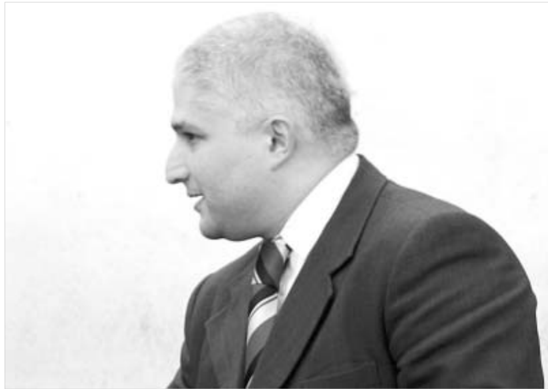
იუსტიციის მინისტრი რესტიტუციის კანონს მიმხრობდა პოლიტიკურ ნაბიჯად მიიჩნევს.

წლების წინათ დაწყებული უმნიშვნელოვანესი პოლიტიკური პროცესი, რომელიც შევარდნაძის ხელისუფლების მმართველობისას არაერთგზის ჩაიშალა, ახლა უკვე პრაქტიკულად განხორციელდება. უახლოეს მომავალში საქართველოს პრეზიდენტის სამსჯიდობო გეგმის ერთი ნაწილი ამუშავდება, მოხდება ყოფილი სამხრეთ ოსეთის ავტონომიურ ოლქში შეიარაღებული კონფლიქტისას დაზარალებულთა ქონებრივი რესტიტუცია. გარდა ამისა, სახელმწიფო კისრულობს ვალდებულებას, დაზარალებულებს მორალური ზიანიც აუზაზღაუროს. საქართველოს სახელმწიფო გამომხატვეს პოლიტიკურ ნებას და მის ტერიტორიაზე შეიარაღებული კონფლიქტის შედეგად დაზარალებულებს, მიუხედავად ეროვნებისა, დიდი ხნის უფლებებს საერთაშორისო სტანდარტების შესაბამისად აღუდგენს.