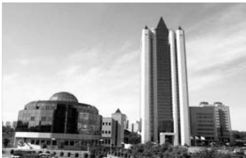
2005 წლის ბოლოდან “გაზპრომის” აქციითა საკონტროლო პაკეტი რუსეთის ხელისუფლება აკონტროლებს.

გუშინ რუსეთის საფონდო ბაზარზე საკმაოდ მნიშვნელოვანი მოვლენა მოხდა. ამერიიდან გაზის გივანტის “გაზპრომის” აქციები საფონდო ბირჟის პრე-ის და მმგვ-ს ინდექსებში გაიყიდება.