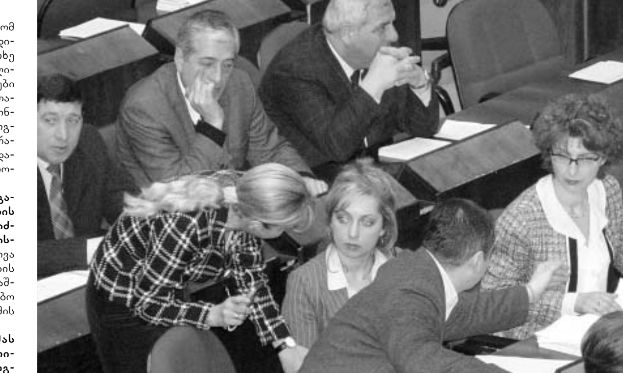
კალანდაძის "გადასარჩენად" კონსულტაციები დრობაზე დიხსო და შეხვედრაზე გაგრძელდა.

"უფრო მეტად ქართველი საზოგადოების აზრს, ვუზღვევთ მესიხს ცენტრალურ ხელისუფ-