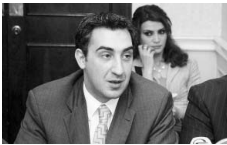
გილაურის აზრით, ინვესტორების მოზიდვისთვის ყველაფერი გაკეთებულია.

ნავთობის, გაზის, ენერჯეტიკისა და ინფრასტრუქტურის მსხვილ საერთაშორისო კონფერენცია-გამოფენის “GIOGIE-2006” მთლიან დღე ელექტროენერჯეტიკის და გაზის სექტორებს, მათ რეაბილიტაციას, პრივატიზაციას და ენერჯეტიკის საინვესტიციო შესაძლებლობებს მიეძღვნა. გუშინ საქართველოს ენერჯეტიკის მინისტრმა ნიკა გილაურმა იმ ობიექტების პრეზენტაცია მოაწყო, რომელთა განხორციელება წელს არის დაგეგმილი. შეხვედრაზე მინისტრმა ჩოგოვაძემ ხმადასვლა განაცხადა, რომ მაკისტრალური გაზსადენი არ იყიდება.