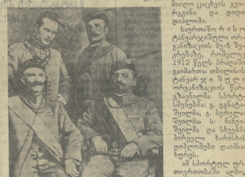
საერთაშორისო ტანვარჯიშული ორგანიზაციის მე-6 შეკრებულზე, რომელიც 1912 წელს პრალისში გაიმართა...