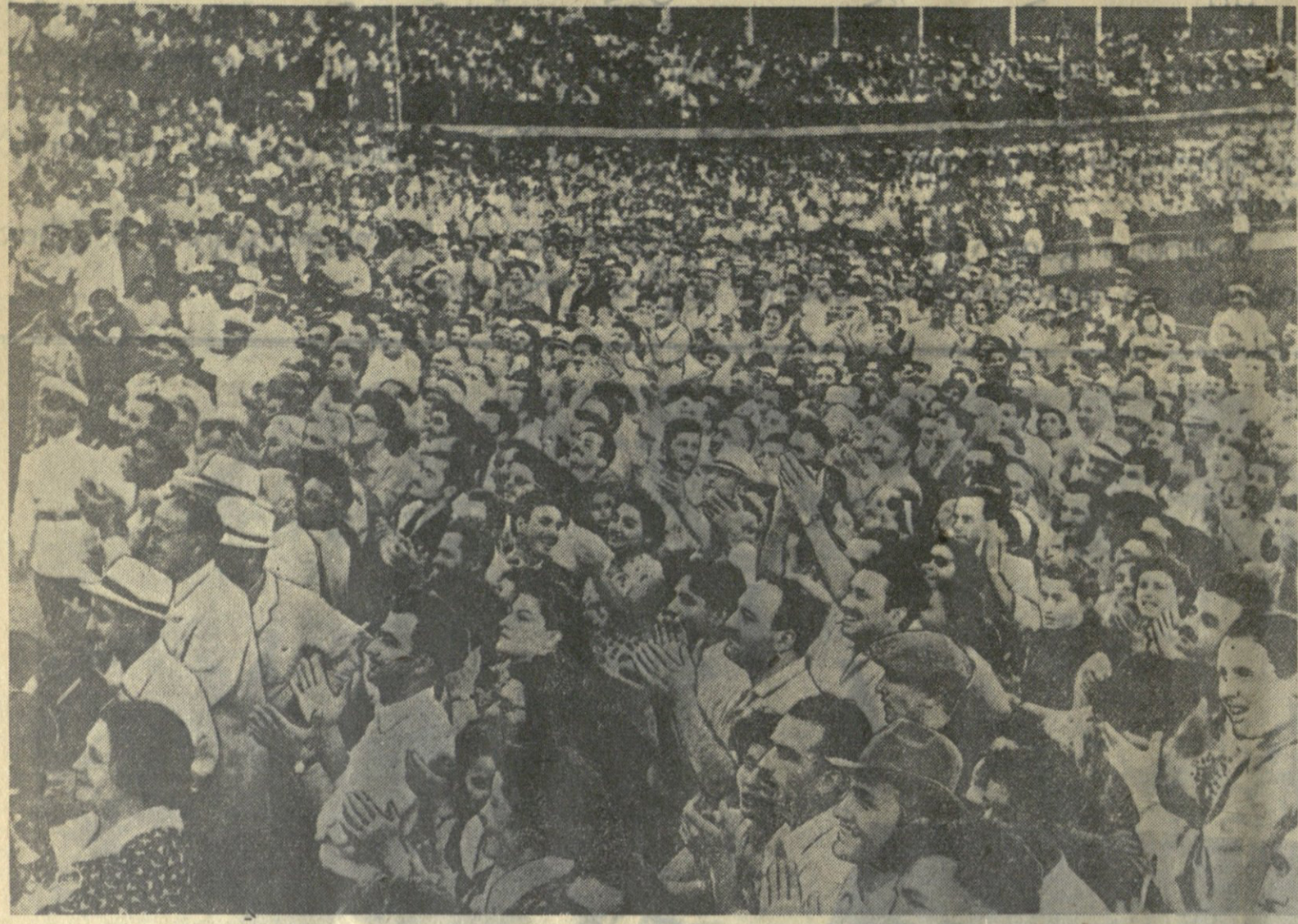
საბჭოთა კავშირ-ჩინოსლოვაკიის მეგობრობის მიტინგი თბილისში „ღინაშის“ სტადიონზე.

(დასასრული) კომუნისტურ პარტიასა და საბჭოთა მთავრობას, რომ იგი კვლავ იქნება საბჭოთა კავშირის კომუნისტური პარტიის XX ყრბის გადამწყვეტილება განაგრძობს და განსაკუთრებით თქვენ მიერ აღწერილ მიზნებს მიმართულად დაეხმარება.