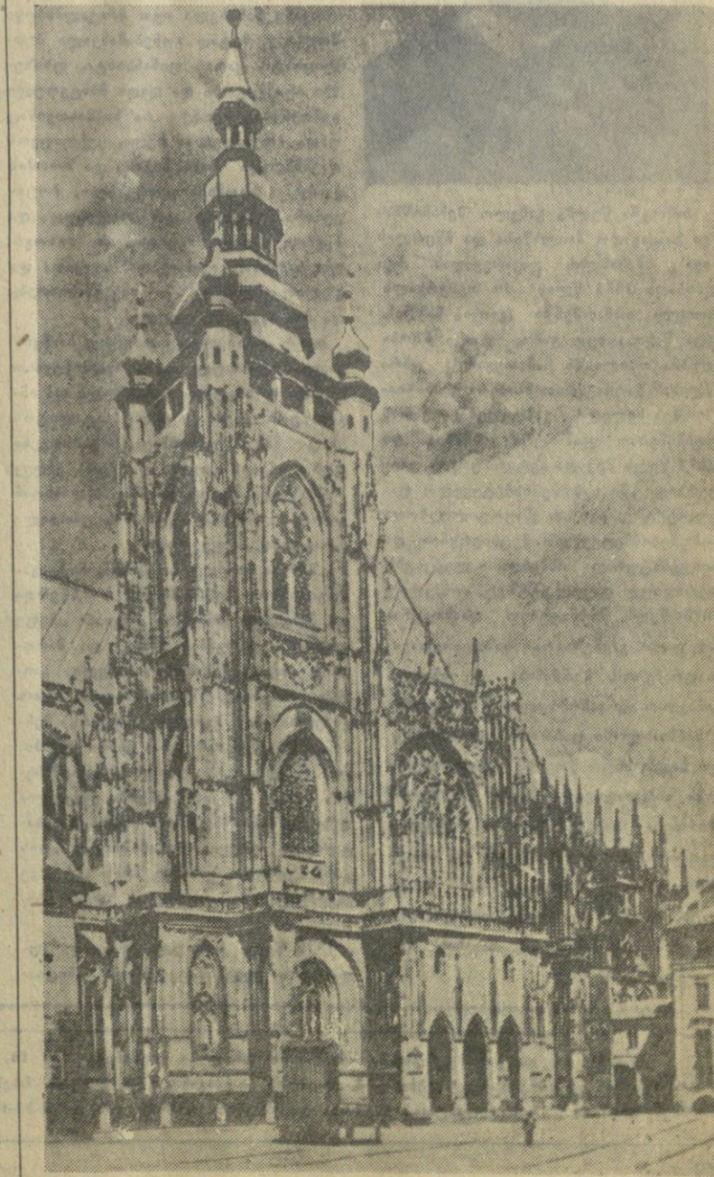
პ. პრალა. წინადა ვიტას ტაძრის გუმბათი (XIV და XVI სს.)