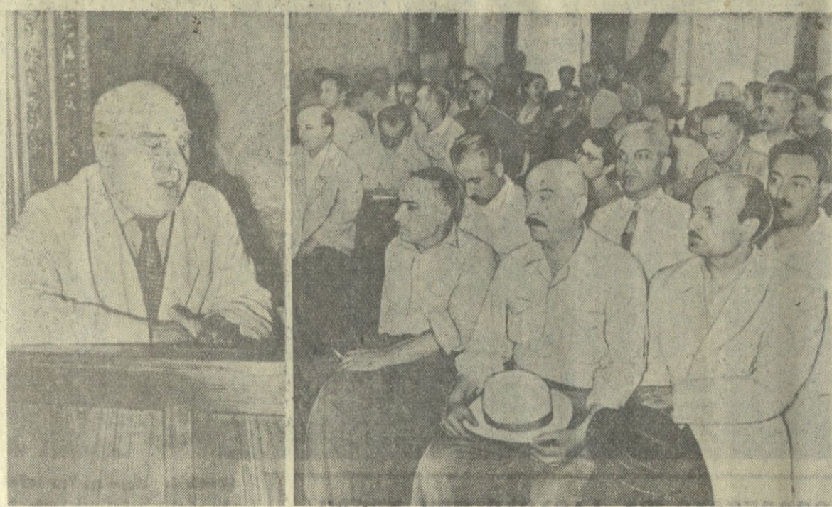
— რა უნდა თქვას იმაზე მეტი, რაც ჩვენს მთავრობის განცხადებაშია წარმოდგენილი? — ამერიკის იმპერიალისტური შტატების ინტერვენცია დაიწყო მშვიდობისმოყვარე ხალხების წინააღმდეგ. მთელი საბჭოთა ხალხი პიროვნულად და გულსწრაფად გამოიხატეს ამ ავსტორიტარ მოქმედების გამო.