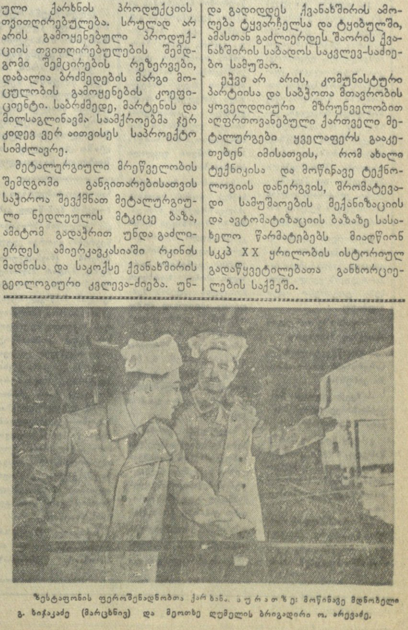
შეტანის მრეწველობის ქარხანაში მუშაკების შრომით მოპოვებული ღირსეულად გამოიყენებენ. მუშაკები თავდადებული შრომით მოპოვებული ღირსეულად გამოიყენებენ.