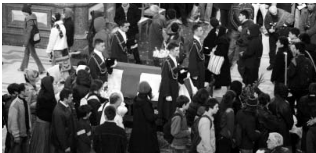
სამოქალაქო პანაშვიდი სამების საკათედრო ტაძარში.