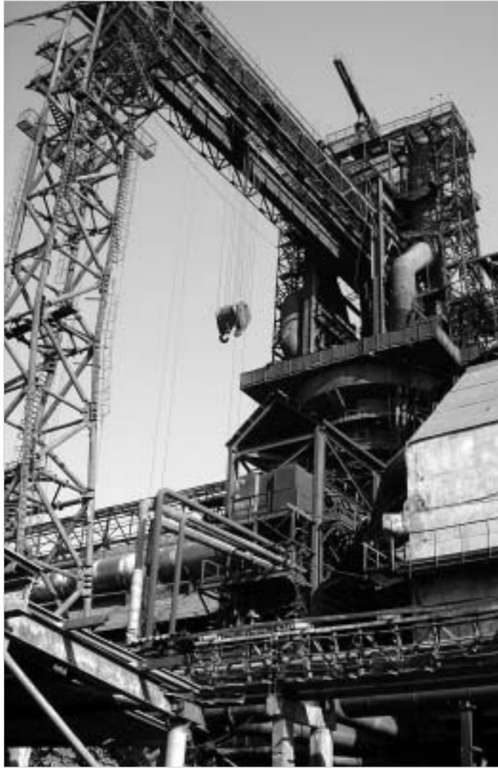
გაგრძელებული მეტალურგიული კომბინატი.