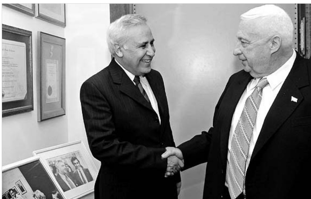
77 წლის შარონი ახალ პოლიტიკურ ნაბიჯებს დგამს.