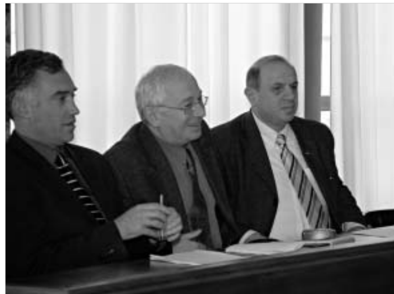
მიუხედავად იმისა, რომ სხდომა აკადემიურად დამთავრდა, მხვატე დაპირისპირების მიხედვით ვერ ასედა.