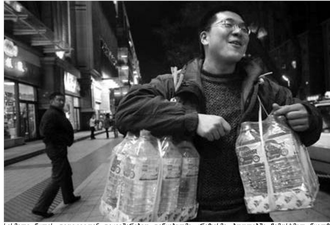
სასმელი წყლის დეფიციტთან დაკავშირებით დაწყებულმა კრიზისმა, ბოთლებში ჩამოსხმულ წყალზე ფასების ზრდა განაპირობა.