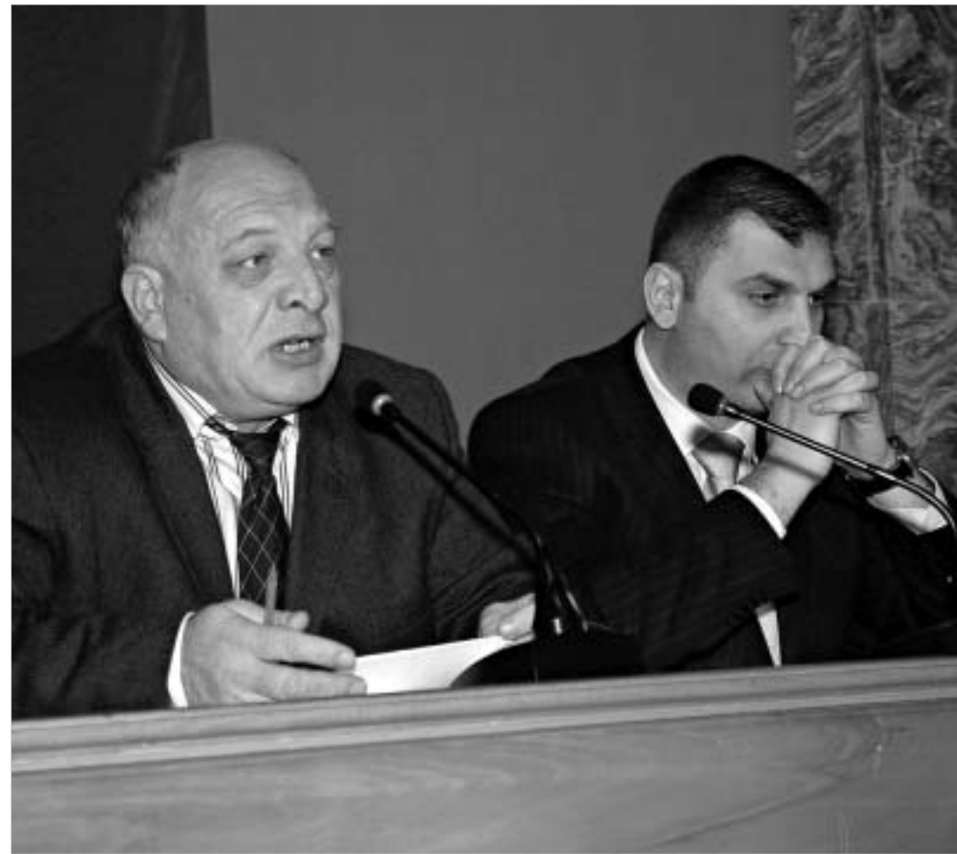
მინისტრებისთვის მუხამრიდად საპარლამენტო კომიტეტი კი არა, სულ სხვა სტრუქტურა - თბილისის საქალაქო სასამართლო იქცა.