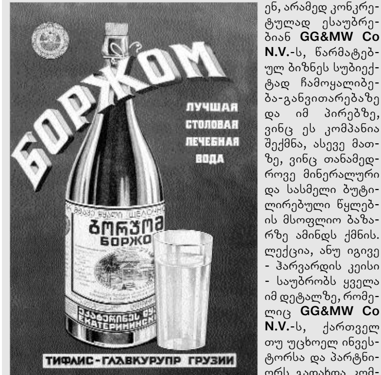
"ბორჯომის" საერკლამო პოსტერი - 1938 წ.

კომპანიის სწორ მენეჯმენტის ის ფაქტიც დასტურებს, რომ პარფარდის უნივერსიტეტში იკითხება ლექცია ბორჯომის შესახებ. სტუდენტებს არა მხოლოდ საქართველოსა და ბორჯომის ისტორიის აცნობენ, არამედ კონკრეტულად ესაუბრებიან იმ GG&MW Co N.V. -ს, წარმატებულ ბიზნეს სუბიექტად ჩამოყალიბებულ განვითარებაზე და იმ პირობებზე, ვინც ეს კომპანია შექმნა, ასევე თანამედროვე მინერალური და სასმელი ბუტილირებული წყლების მსოფლიო ბაზარზე ამინდს ქმნის. ლექცია, ანუ იგივე - პარფარდის კეისი - საუბრობს ყველა იმ დეტალზე, რომელიც GG&MW Co N.V. -ს, ქართველ თუ უცხოელ ინვესტორსა და პარტნიორს გადახდა კომპანიის ფორმირების პროცესში. განსაკუთრებით ხაზგასმულია ის მეთოდები, რომელთა მეშვეობითაც ინვესტორებმა შეძლეს პოსტსაბჭოური ქვეყნებისათვის დამახასიათებელი კორუფციისა და კრიმინალური გავლენის დაძლევა, თანამედროვე საბაზრო პრინციპებზე მომუშავე კომპანიის ჩამოყალიბება და საერთაშორისო ბაზარზე თვალსაჩინო ადგილის დამკვიდრება.