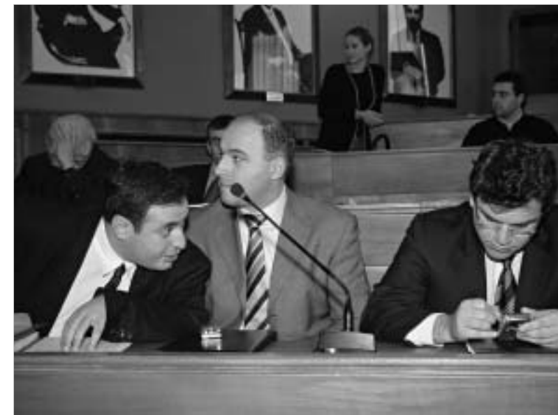
სწავლის სასარგებლოდ არ გამოუტანილია.