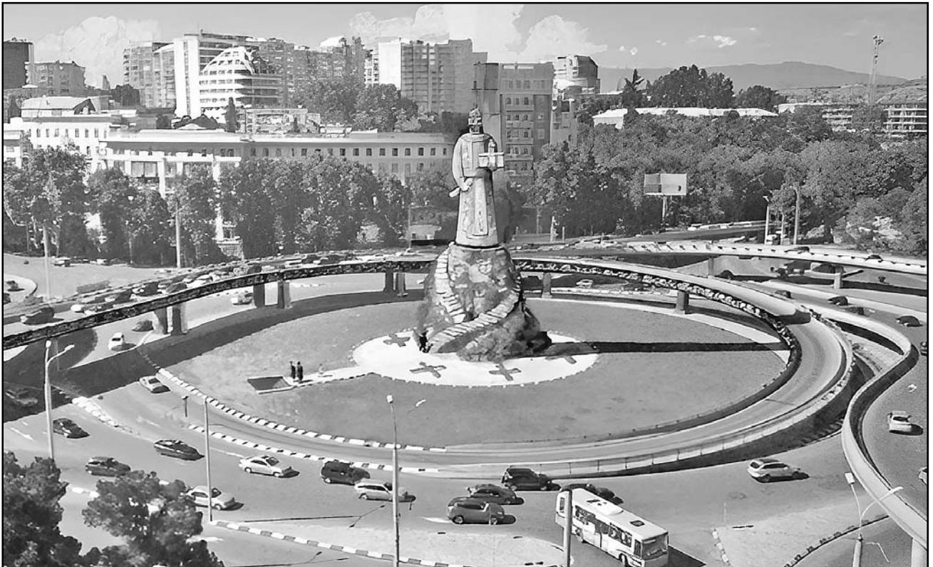
დავით აღმაშენებლის მემორიალის სიბოლური სურათი

გაცრუვდეს ხალხში ზე ფრაზა, საზარი გადასავალი, კაი კი დღესვე გვედრისოს ჭირიდან გამოსავალი,