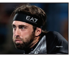
მთაბზადა ბექა გოგინაშვილი

ცნობილ ქართველ ჩოგბურთელ ნიკოლოზ ბასილავილის ნაბაბათის საკუთარ ცუდი სერია ჰქონდა და შემდეგ, რაც სასამართლო ოჯახურ ძალადობაში ბრალდებული ბასილავილი გაამართლა, შესაძლოა, ნიკამ ისევ დაიბარუნოს ძველი ფორმა. ამჟამად ბასილავილი პარიზის მასტერში მონაწილეობს და მან პირველ ნრეში კვენტინ ჰალის დაამარცხა 6:3, 6:4. ბოლო რამდენიმე თვის განმავლობაში ეს მისი პირველი გამარჯვება იყო.