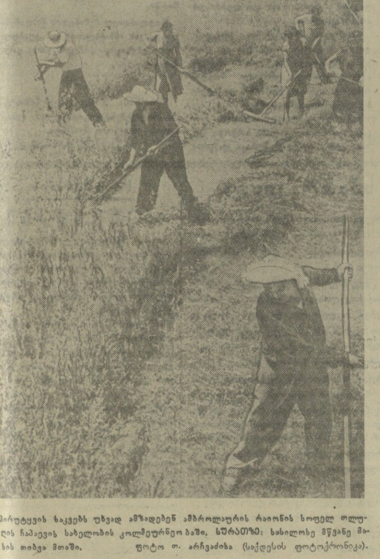
პარტუცის ხაყვებს უხვად ამზადებენ ამბროლაურის რაიონის სოფელ თლუ...