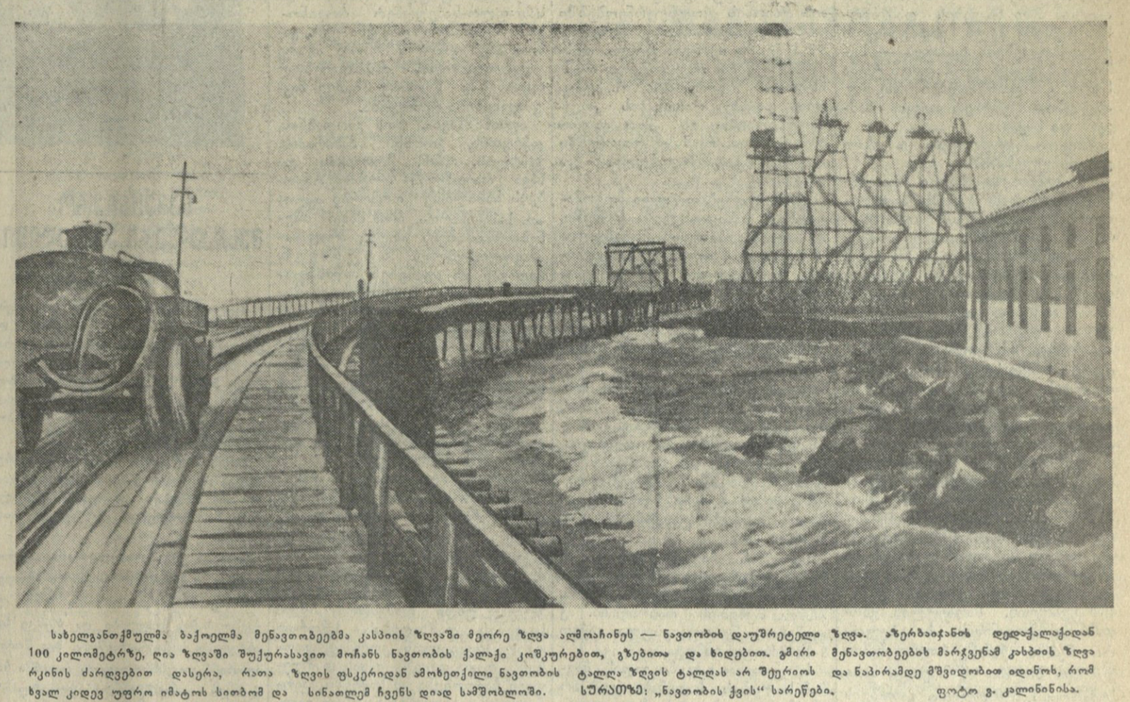
სახელგანთქმული ბაქოელთა მენაფთხობის კასის ზღვაში მდებარე ზღვა აღმოჩენის — ნავთობის დაუზრუნველყოფი 100 კილომეტრზე, ღია ზღვაში უჭურავით მოჩანს ნავთობის ქალაქი კოჭუბეი, გზებითა და ხიდებით. გირი მენაფთხობის მარჯვენა კაბის ზღვა რკინის ძარღვებით დასტრა, რათა ზღვის ფსკერიდან ამოხეილი ნავთობის ტალა ზღვის ტალღას არ შეერიოს და ნაპირამდე მშვიდობით აღწიოს, რომ სწრაფად უფრო იმპროვიზირებული და სინალუმ ჩვენს დიდ სამშობლოს.

„პარპის“ 26 აბვისტოს მონაცემი. რომელიც შეიძლება და უნდა გადაიქცეს ადგილობრივ მოკავშირე რესპუბლიკურ კომუნისტურ პარტიის და საბჭოთა კავშირის მშრომელთა უფლებათა გაფართოებასთან დაკავშირებით მშრომელთა არსებითი საჭიროებების დასაკმაყოფილებლად შექმნილი და აღდგენილი მუშაობის საბაზისი წინადადება. უკანასკნელ წლებში მნიშვნელოვანად აღდგენილია მშრომელთა წერილების შემოსულობა როგორც ადგილობრივ, ისე ცენტრალურ ორგანოებში. მეტი წილი წერილები გასული წლის მარტის და აპრილის თვეებში შემოსულა. მარტის თვეში წერილების რაოდენობა მარტის თვესთან შედარებით მნიშვნელოვნად აღემატება. მარტის თვეში წერილების რაოდენობა მარტის თვესთან შედარებით მნიშვნელოვნად აღემატება. მარტის თვეში წერილების რაოდენობა მარტის თვესთან შედარებით მნიშვნელოვნად აღემატება.