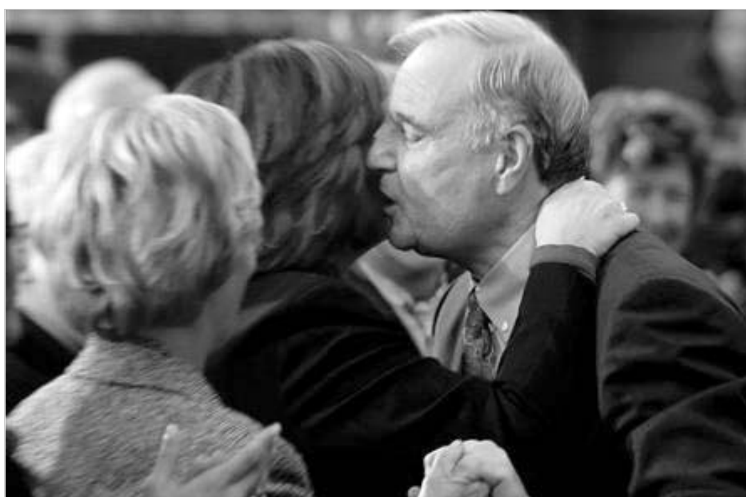
მარტინის კაბინეტს პარლამენტი არ ენდობა. მთავრობა კი პარლამენტის დაშლას მოითხოვს.