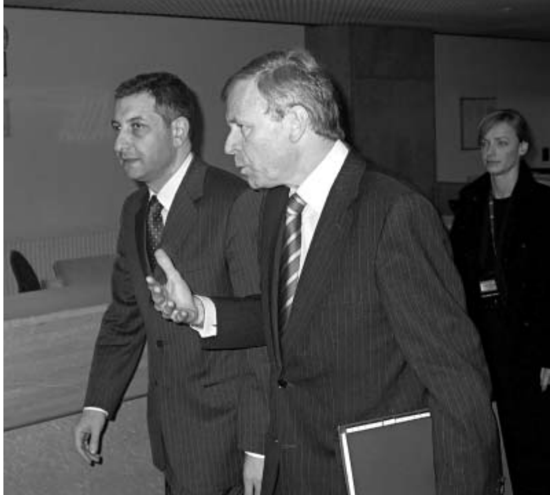
სხეფერი საქართველოს ნატო-ს ლია კარში იხვევს.