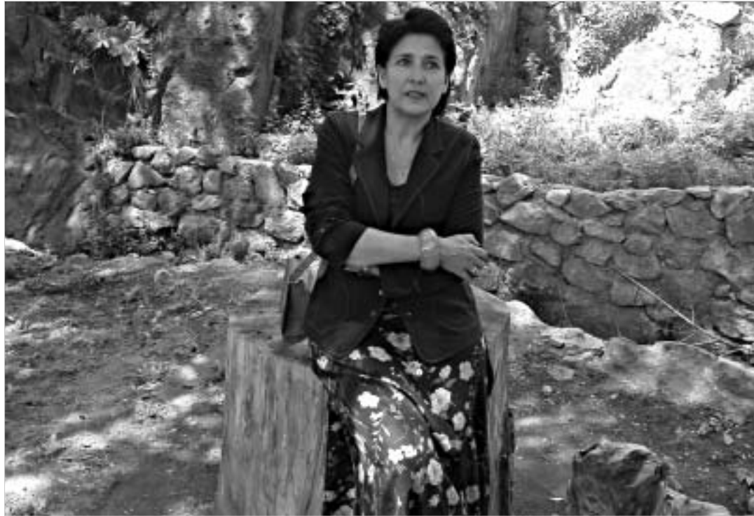
საზოგადოებრივი მოძრაობის ლიდერი სალომე ზურაბიშვილი.