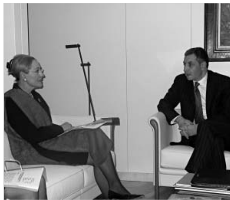
შეხვედრა ევროკომისარ ზურაბ ზოლაძესთან.

ქალბატონმა ვალდებულმა განაცხადა, რომ იგი მიესალმება საქართველოს ევროპულ მიზანშეწონებას, რაც, ევროკავშირის კუთვნილებული შიდაპროექტების განხორციელების თვისობის, ევროპარლამენტის თავმჯდომარის თქმით, ევროპარლამენტი დადებითად აფასებს საქართველოს ბოლოდროინდელ წარმატებებს და მიესალმება საქართველოს სწრაფვას ევროპული სტრატეგიაში.