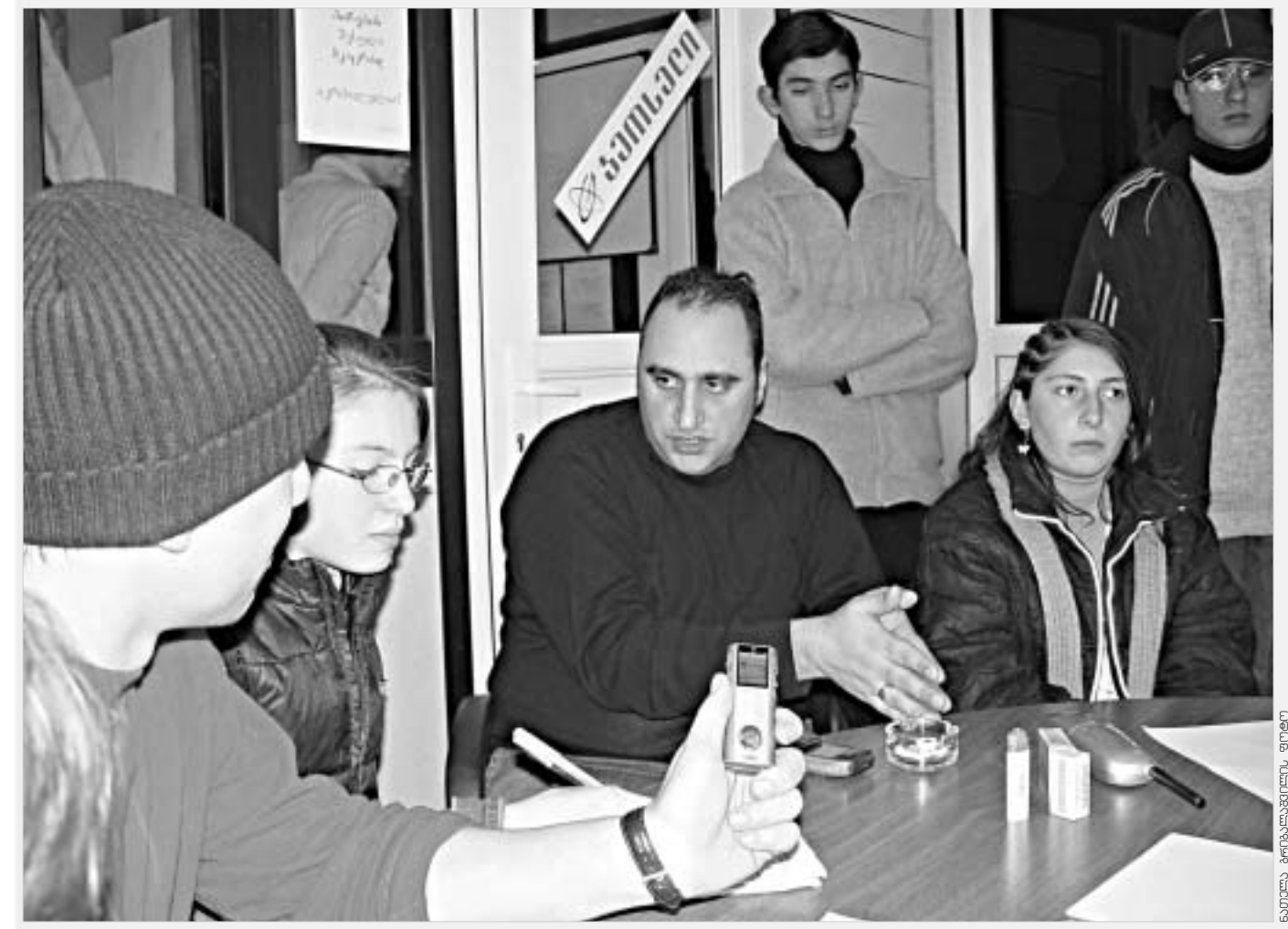
საქმის კონსტრუქციის შედეგად

- მერე დახმარების გაცემა არ სჯობს ჯავშანფილტვები ჩააცვით პატრულს. დონაძე - საპატრულო პოლიცია არის სხვა მიმართულებით მომუშავე, კრიმინალური პოლიცია არის სხვა მიმართულებით მომუშავე, სპეცოპერატიული დეპარტამენტი არის სხვა, არის სხვადასხვა სამმართველო, თუმცა გუნდური პრინციპი არსებობს, ამათ ყველას შსს აერთიანებს, მე მგონი, ჯავშანფილტვით პოლიციელის საზოგადოებაში გასვლა მიუღებელია - ის ოში არ არის. საუბარია იმაზე, რომ პოლიციას დაცვა სჭირდება. შეიძლება საზოგადოების წევრს კრიმინალური დაჯგუფებიდან არაფერი ეშურება, მაგრამ კრიმინალმა შური იძიოს ახლობლებზე, რომელიც პოლიციამ დააკავა, დასაჯა და ა.შ. კარგი იქნება, თუ ახალგაზრდა თაობა ნამოწმებით კამპანიას ცივი იარაღის აკრძალვის შეესახება. ვადაცემა, რომელიც ტელევიზიით გადის კვირაში სამოთხერ არის, რომ ქუჩაში მივდივით და უცნაურად დანა ამოძიო, მომეციო და დამარტყა ფეხში... არაერთი შემთხვევა იყო, რომ დანი თმევენებული ქრილობის გამო გარდაიცვალა... კრიმინალი ყოველთვის იქნება ქვეყნის, განვითარებულ ქვეყნებშიც ახლა... აი, კამპანიაში, რომ ცივი იარაღი აიკრძალოს, ახალგაზრდა თაობა ჩაერთოს, რატომ ვერ შეიკვრება. თუ ნარკომანს, დანიან ადამიანს არ მივლით ჩვენს წრეში... ცუდია, როცა ტიპი დადის დანი, ეს ზრდის კრიმინალურ შემთხვევებს, რატომ შეხედ ჩემს გოგოს და ამგვარები... ძალიან მნიშვნელოვანია ნარკოტიკი, მაგრამ დავიწყებით დანების ტარების წინააღმდეგ ბრძოლა.