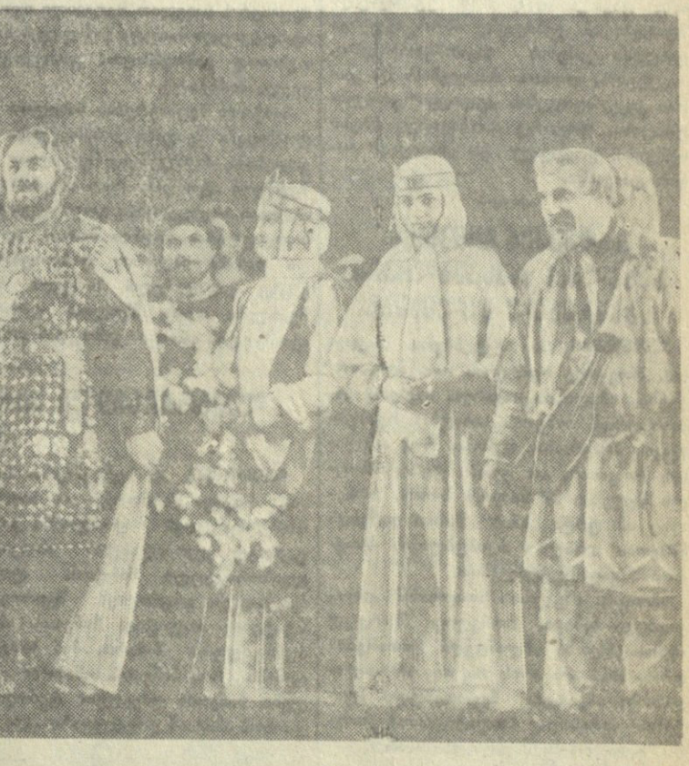
სენა ოპერისა და „თავადი იგორი“.