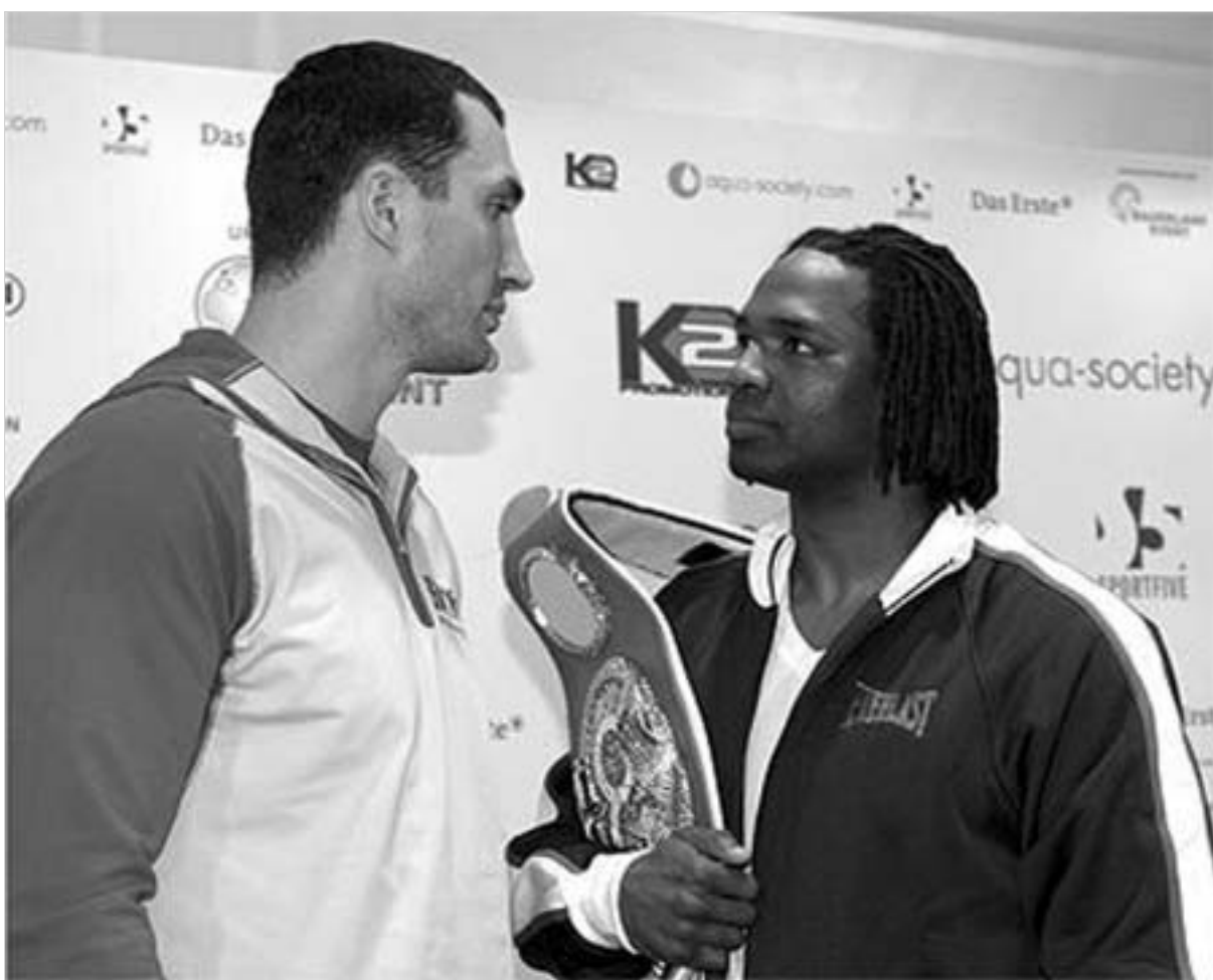
კლიჩკო ბერდს ქამრის წარმომგებას უპირებს.

თქმით, მისი ვაჟი ხუთი წლის განმავლობაში ძალზე შეიცვალა - უკეთესი გუნდისკენ. ის ახლა უფრო ხისტი და ახლად მამამისი უკ ბერდი. ბერდების ოჯახს მოყვა უკრაინელი და მისი მწვრთნელი დამსწერი სტი-ურადი. უწყველი კი ის იყო, რომ მოკრეფები ერთმანეთს შეტად მეგობრულად შეეცნენ. ერთმანეთის სუბტილ პატივისცემით განსაზღვრის შემდეგ მოკრეფები და მათი თანმშლები პირნი დაშორებულ ცნობისმოყვარეობის დაკმაყოფილებას შეუდგნენ. ჯო ბერდის