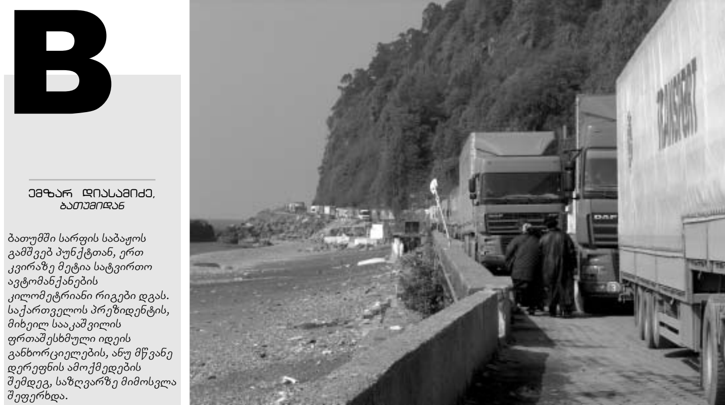
ასეთი მდგომარეობაა სარდის საბაჟოს მისადგომებთან.