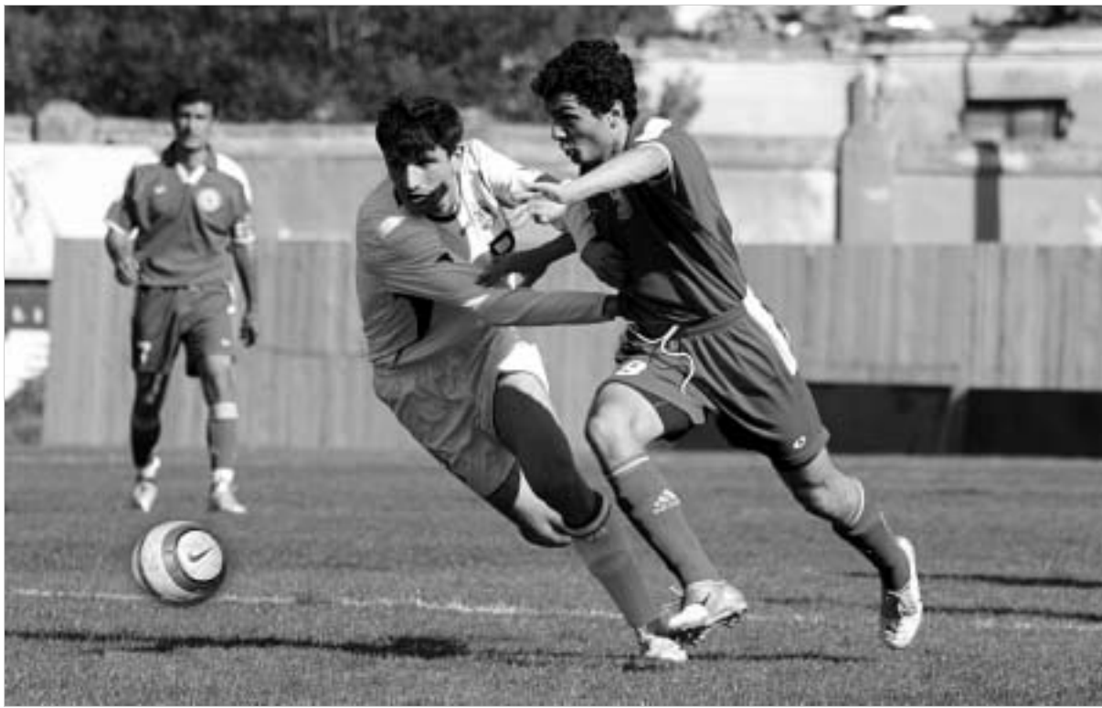
"ლოკომოტივის" დამარცხება "დინამოსთვის" დიდი ვერაფერი შევბაა.

ამდენად, იყო საშიშროება, რომ რაღაც ანალოგიური, გენეზით, რევენშისტული გუშინაც მომხდარიყო, მაგრამ, ვერ ერთი, თავად ბოლნისელი გულშემმატკივრები მოიტყვნენ უარგონსდეთიურად და სტუმარბაჰსინების ლობის ყველა წესი დაიცვეს. ამას გარდა, სამართალდამცავი ორგანიზაციები მობილიზებული იყვნენ, თუმცა, მათი სიფრთხილე და სიფიზილუ საჭირო აღარ გახდა. მატჩამდე არსებული სატურნირო მდგომარეობა "ვიტ ჯორჯიას" უკანდახვევის შანსს არ ჰყოფნის. "სიონის" ვეტერინართა კლუბს საინტერესო კიდევ იმით იყო გამოირჩეული, რომ ის შეხვედრა პრაქტიკულად არც წამთავრებულა. მატჩის დასრულებას რამდენიმე დრო აკლდა, რომ ეროვნულ სტადიონზე დაიწყო უსწრაფობები, რაც "სიონის" გულშემმატკივრების მხრიდან იყო ინსპირირებული. საბუნდევოდ, სეროიზულად არავინ დაშვებულა. თუმცა, ეს "ოქროს მატჩი" მაინც ქართული ფეხბურთის ისტორიის ყველაზე შავი ლაქაა.