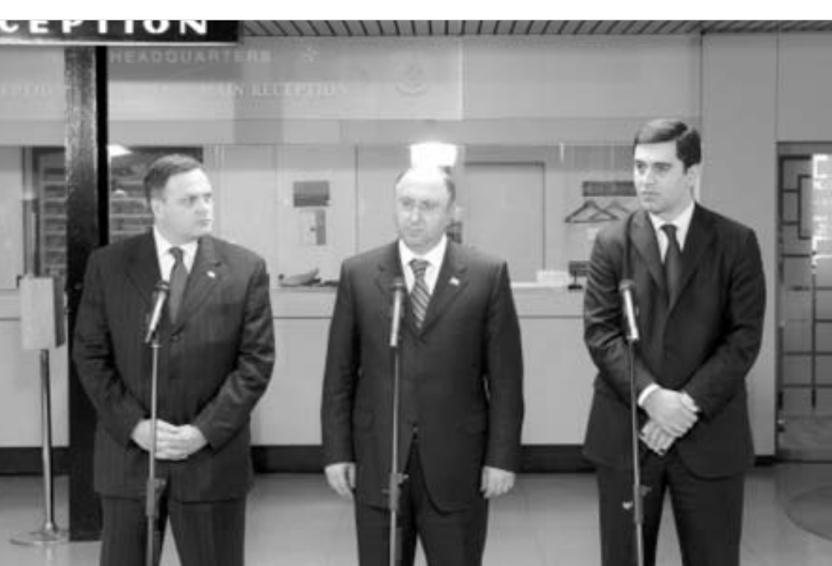
მრედლოტანტიკური საბჭო-საქართველოს შეხვედრა ნატო-ს შტაბშიში მიმდინარე წლის 13 აპრილს შედგა.

ამ თვალსაზრისით, მხედველობაში უნდა იყოს მიღებული ჩვენი SDR-ზე მუშაობის ერთი მნიშვნელოვანი დეტალი: უსაფრთხოების დინამიკური ზრდა საქართველოში და საქართველოს ფარგლებს გარ-