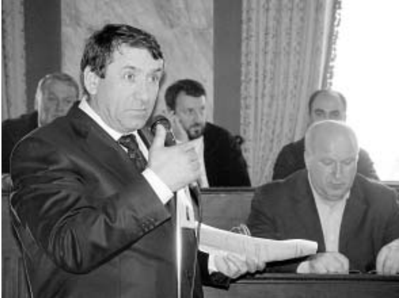
რელიგიური სიმბოლოების დაბრუნება ახლო მომავალში არარეალურია.

საქართველოსა და რუსეთს შორის დღეს არსებულ მწვავე პოლიტიკურ და ეკონომიკურ დამორჩილებას მალე, ალბათ, რელიგიური თემატიკაც დაემატება. ასეთი ვარაუდები გამოთქმის საფუძველს იძლევა პარლამენტის დადგენილების პროექტი, რომელიც 1801 წლიდან 1991 წლის 9 აპრილამდე რუსეთის მიერ საქართველოდან გატანილი რელიგიური სიმბოლოების დაბრუნების ითვალისწინებს.