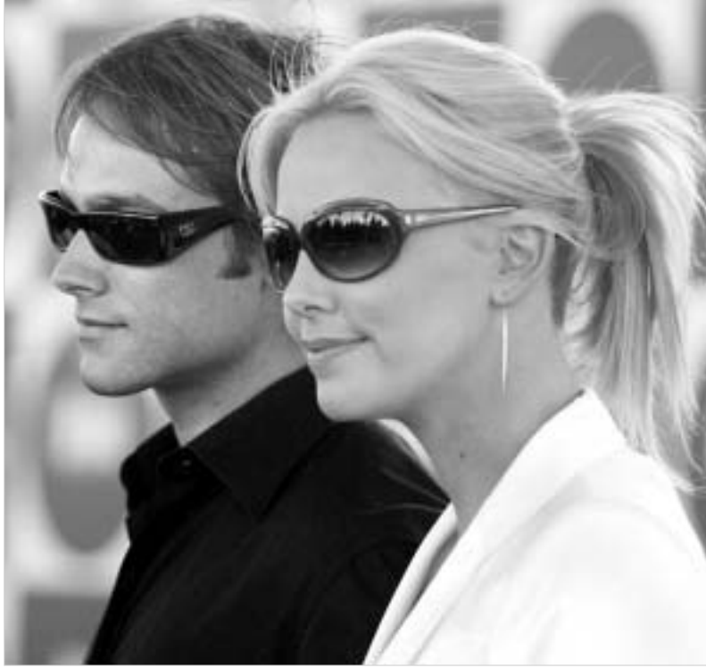
შარლიზ თერონი და სტიუარტ ტაუსენდი.

"ვერწმობ, თუ რა ბედნიერი ვარ, რადგან მაქვს ურთიერთობა ასეთ მშვენიერ ადამიანებთან." - აღნიშნა თერონმა დაჯილდოებისას. "შე არ მიამაჩნია გამართლებულად, რომ ჩვენი ქვეყნის სექსუალური ორიენტაციის გამო გვე-