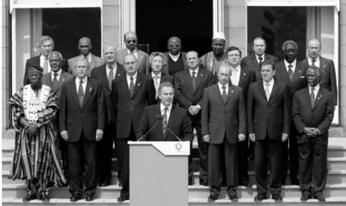
"დიდი რვიანის" უკანასკნელ სამიტს ლონდონის ტერატი დემონსტრაციაში.

შემდეგ კი ცენტრალური და აღმოსავლეთ ევროპის ქვეყნები იძულებული გახდებიან, მოსკოვის ნებას დაემორჩილონ. ასე რომ, კრემლის აზრით, დროის დაკარგვა მათთან ურთიერთობაში სადავო საკითხების გადაწყვეტაზე არ ღირს. "ვაშინგტონისთვის ცნობილია მოსკოვის შორს მიმავალი გეგმები ევროპის ენერგეტიკული დამყარების მიზნით," - აღნიშნავს საიზონ არალოფი. და სწორედ ამ ინფორმაციით არის გამოწვეული აშშ-ს რესპუბლიკური პარტიის წამყვანი წარმომადგენლების მოთხოვნები "დიდი რვიანის" პეტერბურგის სამიტის პოიკოტის თაობაზე. ასეთი მოწოდება, კერძოდ, თებერვალში, უსაფრთხოების საკითხებზე მიუხეხინის საერთაშორისო კონფერენციაზე რესპუბლიკური სენატორმა ჯონ მაკკეინმა გააკეთა. "პუტინის რუსეთი დღეს არც დემოკრატიაა, არც მსოფლიო ეკონომიკის ერთ-ერთი ლიდერი. და მე სერიოზულად მეპარება ეჭვი იმაში, რომ "რვი-