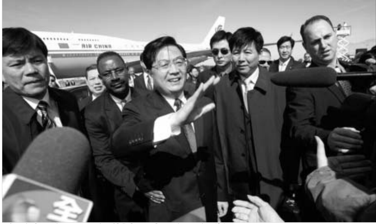
ვიზიტის მთავარი და ყველაზე მნიშვნელოვანი ეტაპი დღეს იქნება.

თავი მაინარადა გუშინ დაიწყო ჩინეთის თავმჯდომარის ოთხდღიანი ოფიციალური ვიზიტი აშშ-ში. ვიზიტის ფარგლებში დაგეგმილია აშშ-ს პრეზიდენტ ჯორჯ ბუშთან ტაივანისა და ირანის საკითხებზე მოლაპარაკებების გამართვა, საფინანსო და ეკონომიკური საკითხების განხილვა, ვიზიტი "ბონინგ"-ის ოფისებში (აღსანიშნავია, რომ მაიკროსოფტმა და "ბონინგ"-მა ახლახან ხელი მოაწერეს ჩინეთთან კომერციული შეთანხმებას), სადღიო მაიკროსოფტის გენერალურ დირექტორთან ბილ გაითისთან და ა.შ.