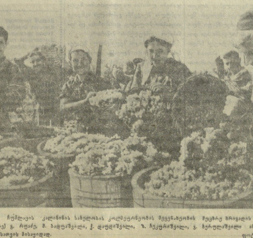
სოფელ ჩუშაყის კალინინის სახელობის კომუნისტური მოსახლეობის მებრძოლი მუშაკები...