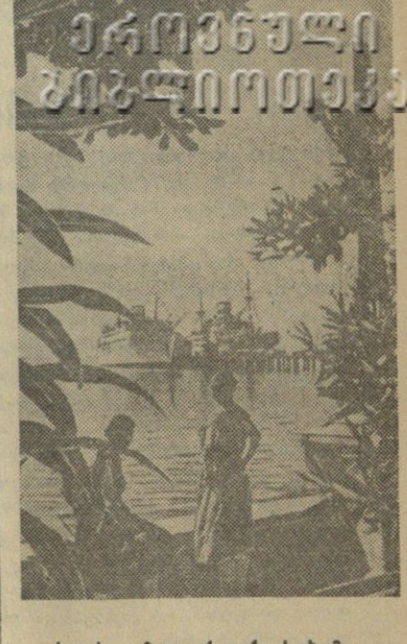
სურათი: ქალაქი ხოხობი. ხელისუფლების მდივანი