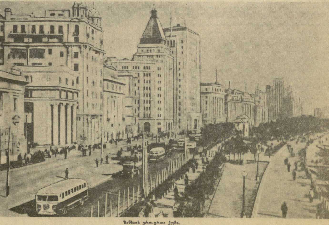
შენების ერთ-ერთი ქუჩა.