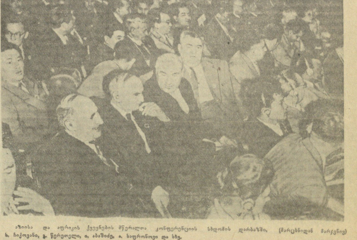
ბაბაშვილი (ერაყელი პოეტი)...