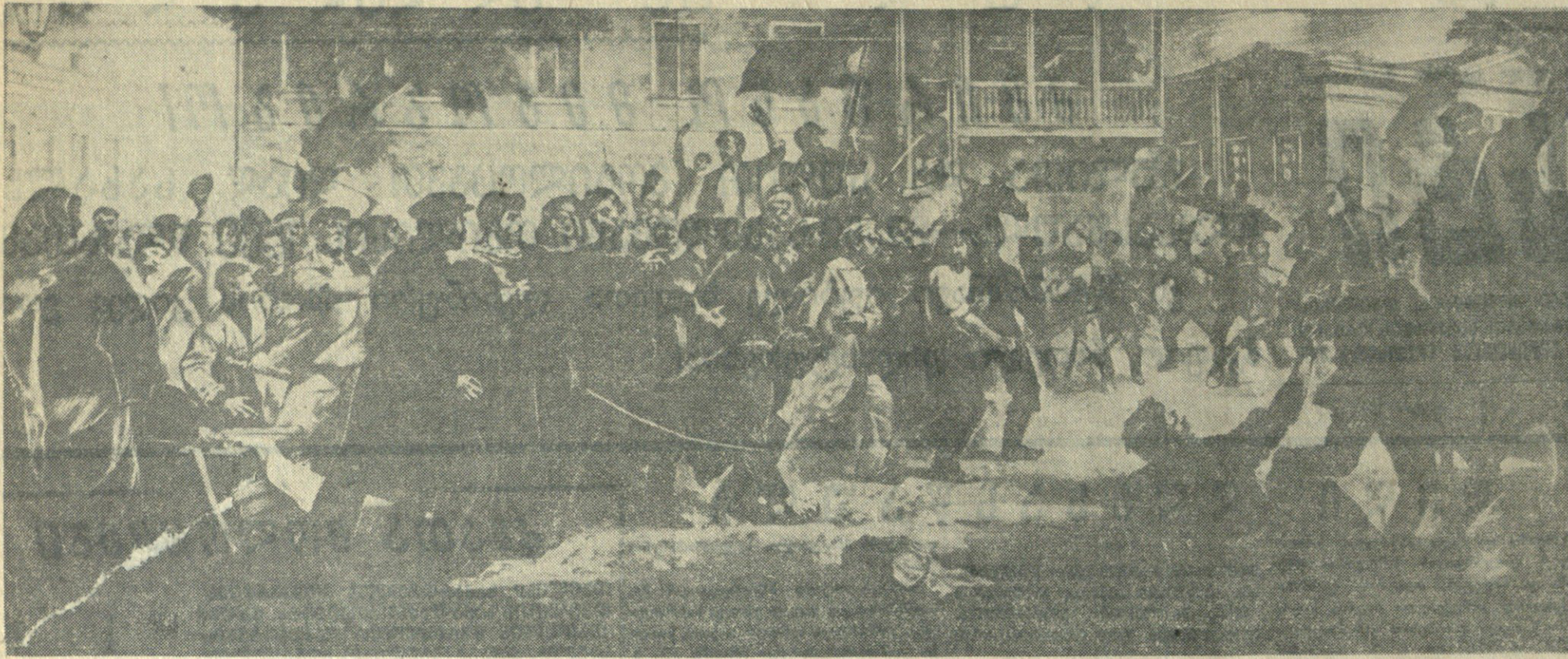
საბრძოლველად დემონსტრაცია თბილისში 1901 წელს.