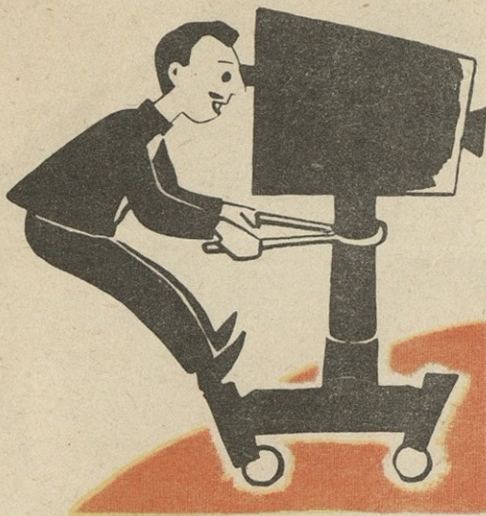
შია ნიანგო, გამარჯობა!