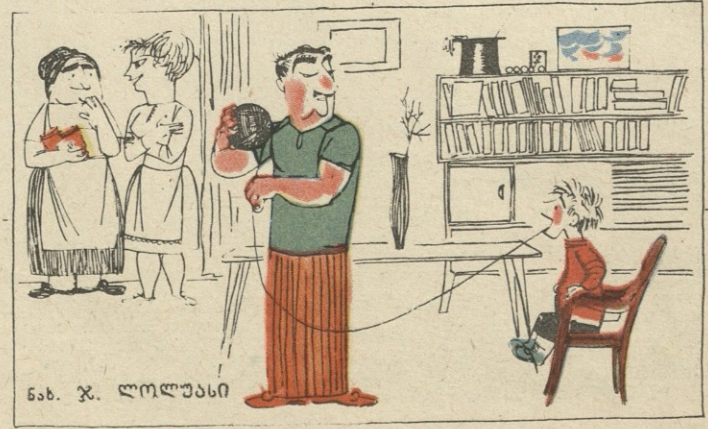
ნ.ბ. ჯ. ლოლუასი

შვილსაც ილუზიონისტად ზრდი? არა, ჩაურჩხებელი კაფიანად შემუშავია!