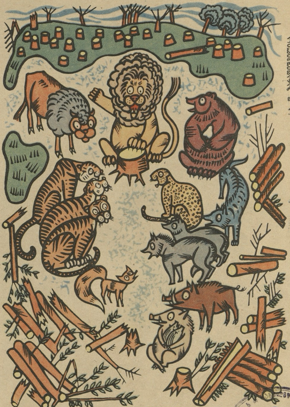
ახ. დ. ზარაფთაშვილისა

ლოგი: ადვილთ და მითხარით, რომელმა მხეცმა ჰქენიქვას?!