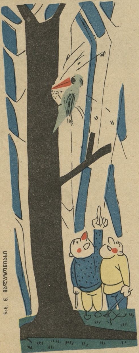
ნ.ბ. ნ. მაღალკონიანი