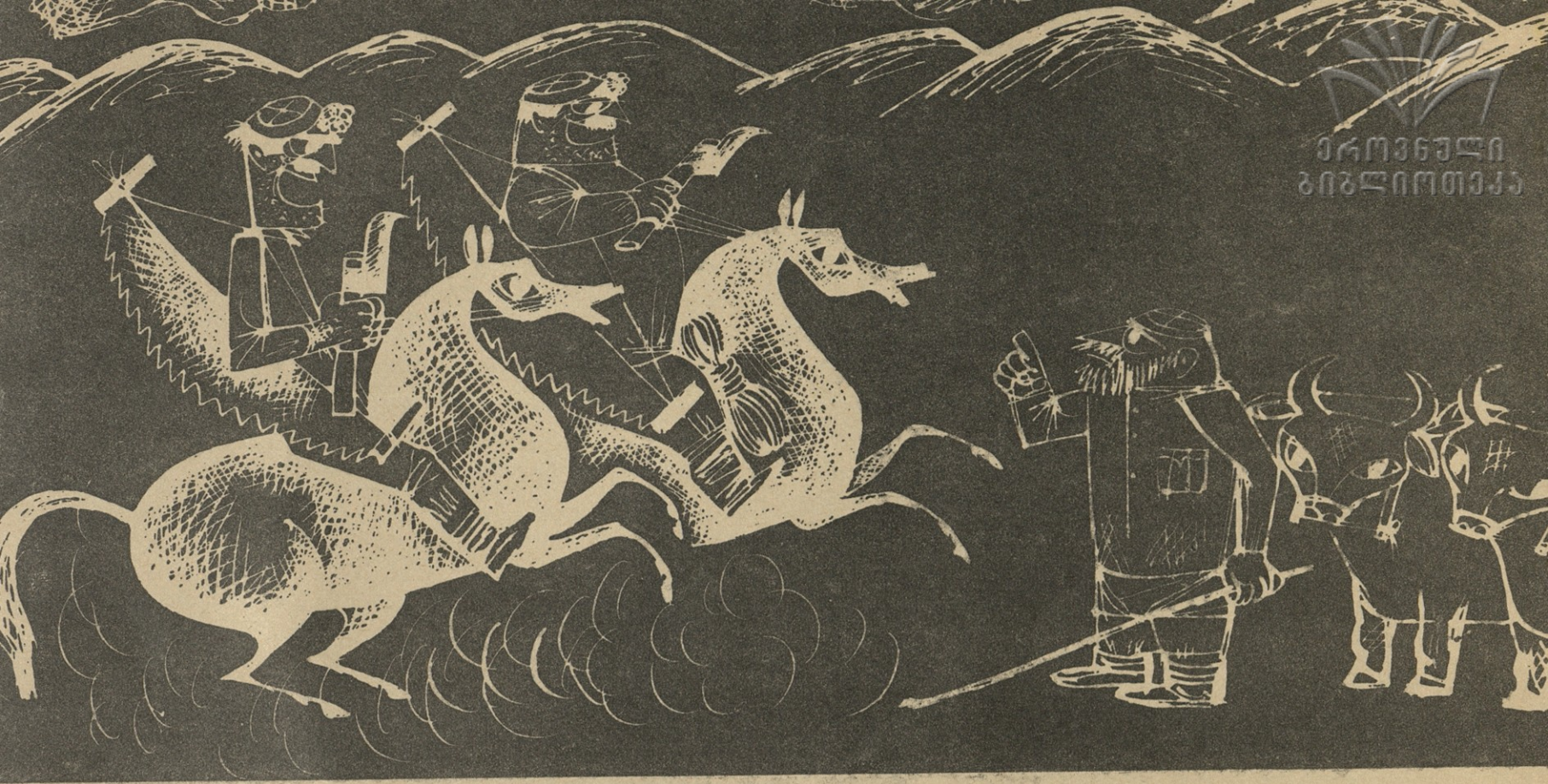
ნ.ბ. ჯ. ლოლუასი