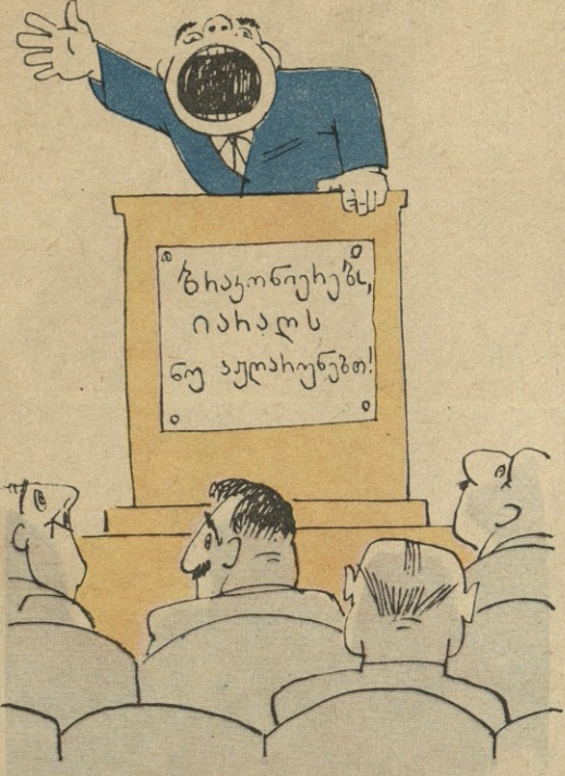
ნ.ბ. ბ. ფირსანკალანის

რესპუბლიკის რაიონებში დიდი რაოდენობით აქვთ სანადირო თოფები იმ პი- რებს, რომლებიც მონადირეთა კავშირის წევრები არ არიან და თოფებიც, დაღ- გენილი წესით, რეგისტრაციაში არა აქვთ გატარებული.