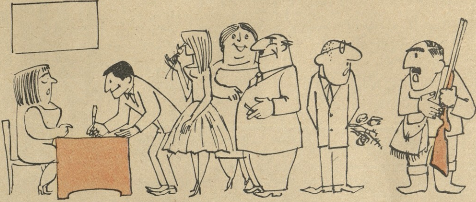
— ცოლს თხოულობა? — არა, თოფს! ოცი ფალია, რეგისტრაციაში გაუტარებლად მაქვს.