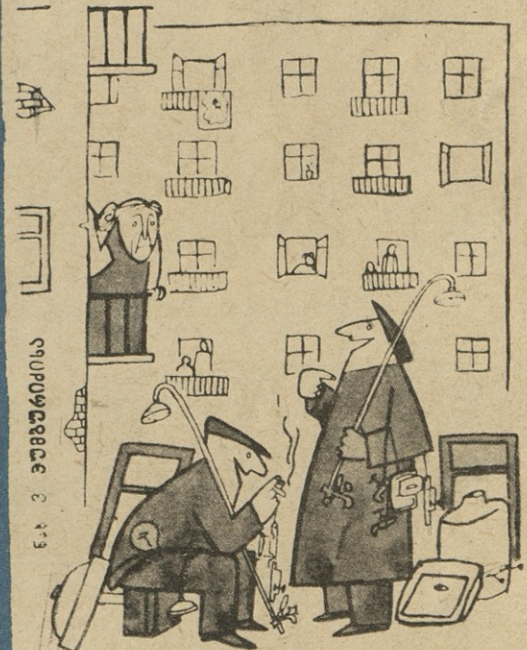
— თქვენ გპირდებით ონკანები, კლიტები, ნათურები, გაყვანილობა, უნიტასი! — თქვენ რა იცით?! — როგორ რა ვიცით? სახლი ჩვენი აშენებულია!