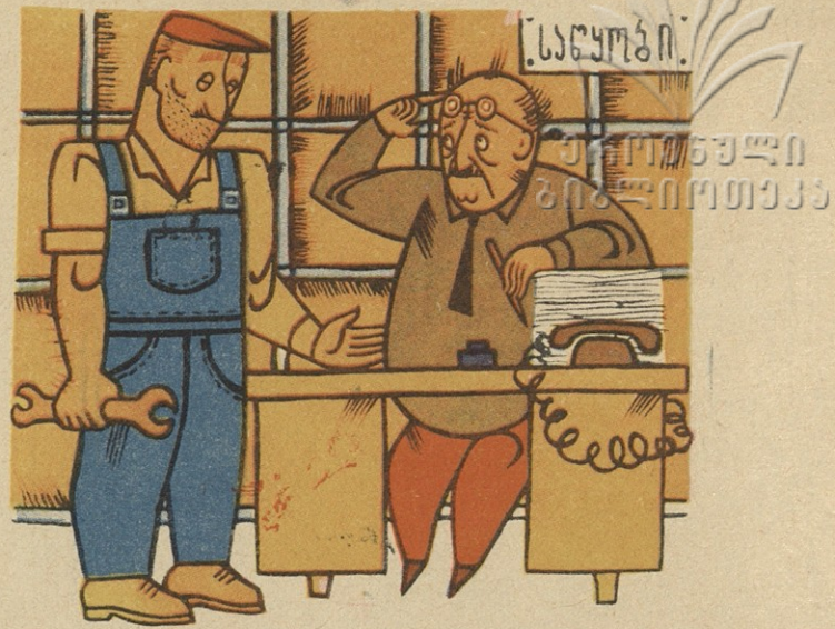
— გვიხველეთ, საშენი მასალები გვაქლია; — შენ ხომ არ გვაქლია?!

ცხადია , შავი ფეკლისგან ტორტი არ გამოცხვება და მაჩვის რძისგან კარაჭი არ მოიღვებება, ვერც ცუდი მასალისგან აშენდება კარგი სახლი. ეს იცის ყველა მშენებელმა, ეს იცის რკინა-ბეტონის ნაკეთობათა პირველ და მეორე ქარხნებში, ეს იცის რკინა-ბეტონის ნაკეთობათა მეორე კომბინატშიც, იცის „საქმშენინდუსტრიის“ მუშაკებმაც, იცის და მაინც მათ მიერ გამოშვებული პროდუქცია უხარისხოა, დღემდე ვერ აღმოუფხვრიათ საპროექტო ზომების, ტექნიკური პირობების, ნორმებისა და სახელმწიფო სტანდარტის დარღვევის შემთხვევები.