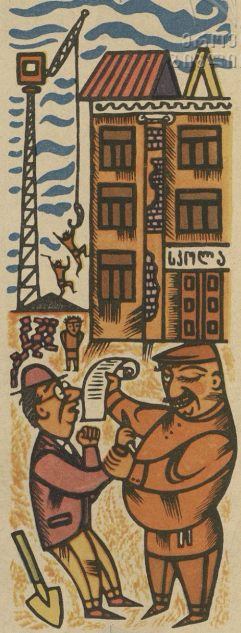
— ამ სახით ვერ ჩავიბარებ, შენობა გადაუსურავია! — ეს მოწყალებს დაუბოვით, შრომის გაკვეთილებზე გადასურავენ.