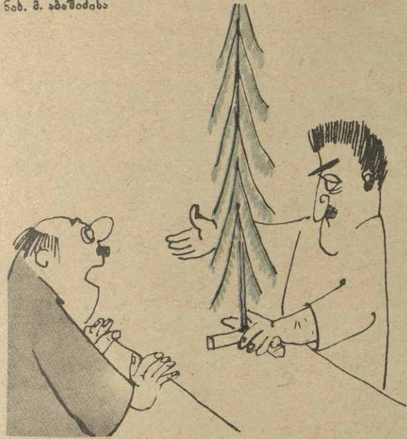
— ეს ხელოვნური ნაძვის ხეა. მე ცოცხალი მივლა! — ცოცხალი და შეამია ამ არ იმიღება!