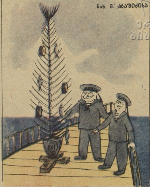
ახალი წელი გემზე