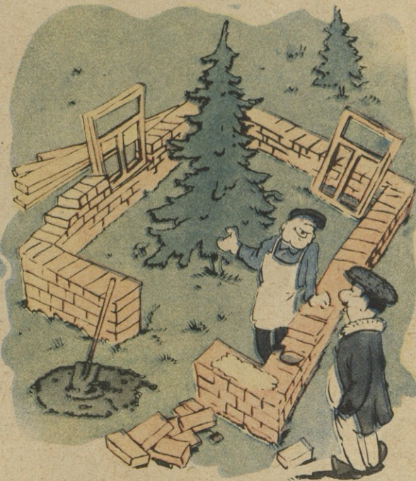
— რაღა ამ ტყვეში აშენებ სხლს? — ნაძვის ხის მოჭრა აკრძალეს და ახე ვამოგონებო

საექსპერტო კომისიას საჭიროდ მიანია აღნიშნული თუნუქის სახურავი მოიხსნას და რკინა-ბეტონის გადახურვაზე მოეწყოს ბრტყელი სახურავი სათანადო ქანობით“.