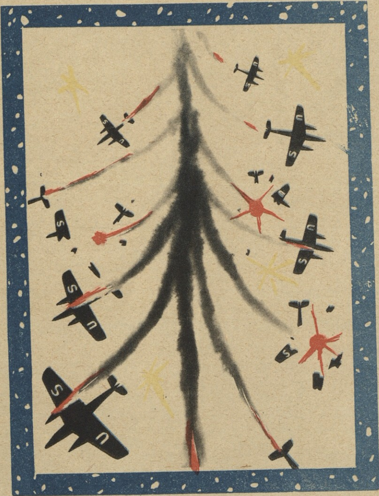
ვიეტნამური საახალწლო ნაძვის ხე.

თავდაცვის ყოფილი მინისტრი შტრაუსი დაბეჯითებით მოითხოვს „ვეროპის ატომური ძალების“ შექმნას.