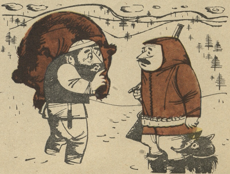
ნ. ს. ზ. ფორჩინისა

1968 წლიდან ნიანი აწეობს ექსკურსიას მთაწმინდაზე... დარჩენით. მსურველებს ვთხოვთ, წამოიძღვანიონ დაფნის გვირგვინები და რამდენიმე უკვდავი ნაწარმოები!