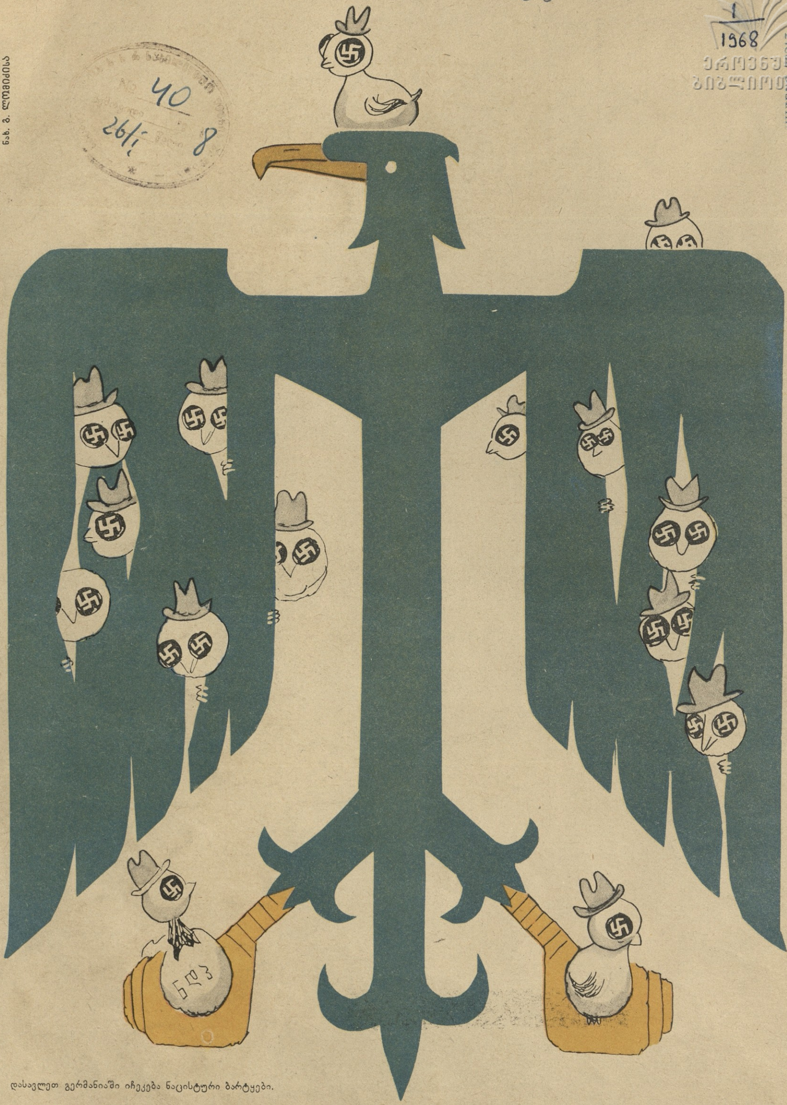
დასავლეთ გერმანიაში იჩეკება ნაცისტური ბარტყები.