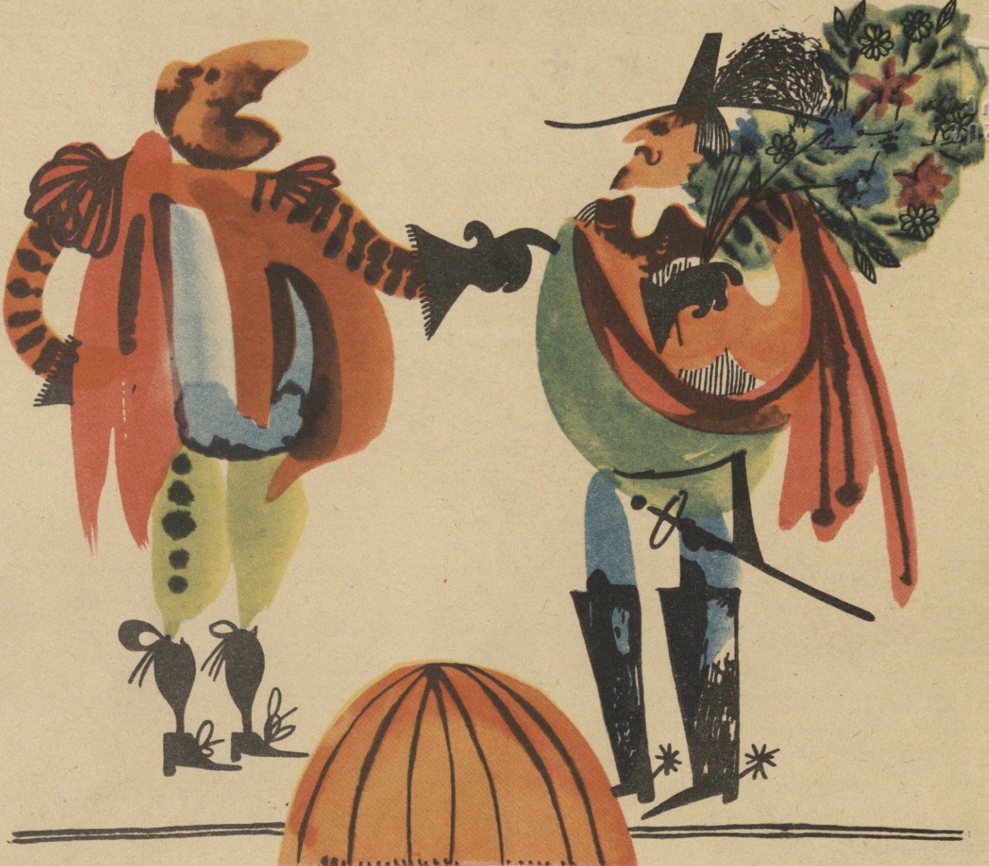
ჩემი თაიმბული რატომ მიისაქუთონე? კამო, შენ მასუკელი ვისია? ჩემს ბალში დაპარიფი.