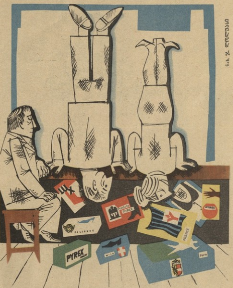
ნ. ა. ლილუაში