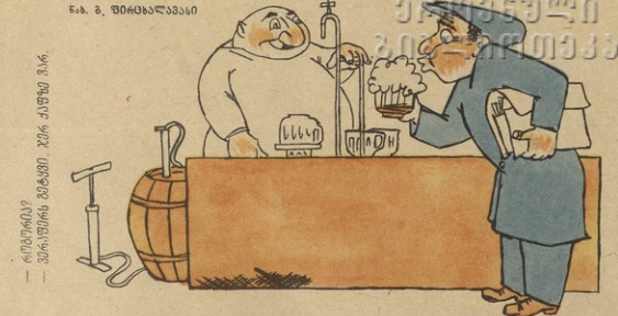
რითინი? მინდურნი მინდური ჯინე ადუბე ვინ.