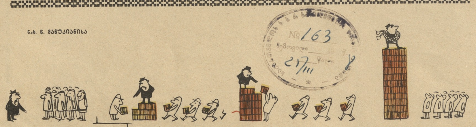
ნახ. 5. მანუკიანისა