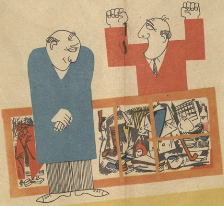
— რატონ მალაყთ დაცლენი მებრ საკინდს? — გარმანენიყ და მერ ვარინთ, გატონი!