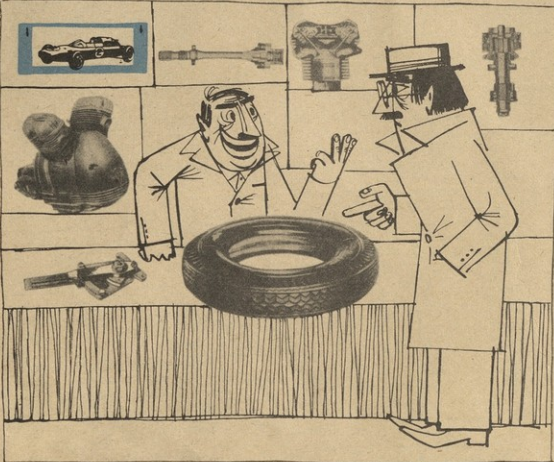
კლიენტო, ორი საპარკონი ფული გათხოვრისებ და მისთ გაკლავა? მკმედილელი: მთე მადურობიანით გაკრიგბ მთი კრ ითი? ორი საპარკონი თუ მინდო- ლა სპრის ფული უნდა გათხოვრისებ!