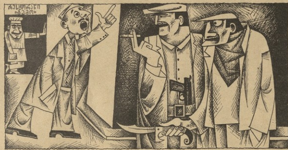
ნ. ა. შ. შაბუაძისა