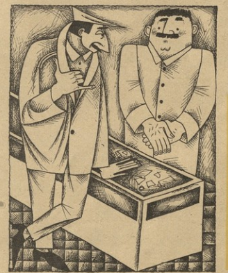
„მინიორე“ მამას? კაკაბსა, თუ მინდა, იანდოდ მინდებ!