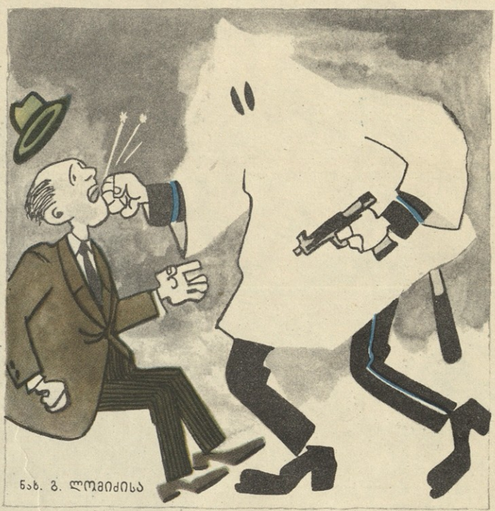
ნ. გ. ლომიძისა

— კოლიცია!.. კოლიცია!.. - კოლიცია ვარ, კაპ, ვინა ვარ?!