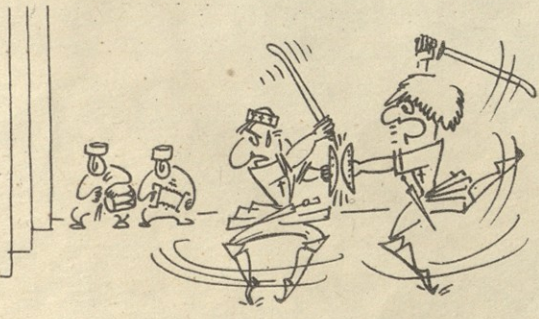
ნ. ს. სინსარულიძისა