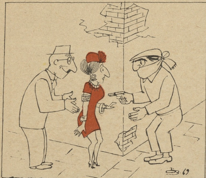
— გეჭდები!... საყურები!... ბრასლებები!... საათი და სხვა სამკაული!... — მაღალს თუ შვრები, გარემ ესეც თან მიყვალე!

— ლენა, რატომ მიიღე ორიანი ისტორიაში? — სრულიად უბრალოდ, დედოქო: მასწავლებლის კითხვა და ჩემი პასუხი ერთმანეთს არ დაემთხვა.