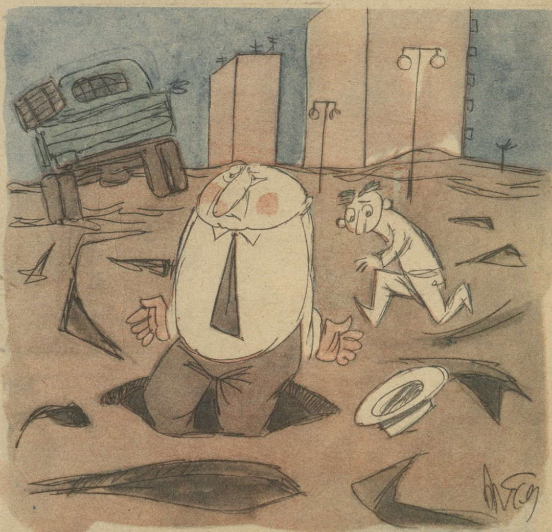
ნახ. ნ. მაღაზონიანი