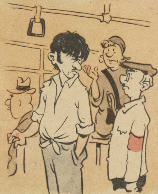
— მოქალაქე! უბილეთოდ მგზავრობისათვის გალაიხადეთ ჯარიმა 50 კაკიკი! — აჰან 3 კაკიკი არ გალაიხა და 50 კაკიკის მოგცემს?!