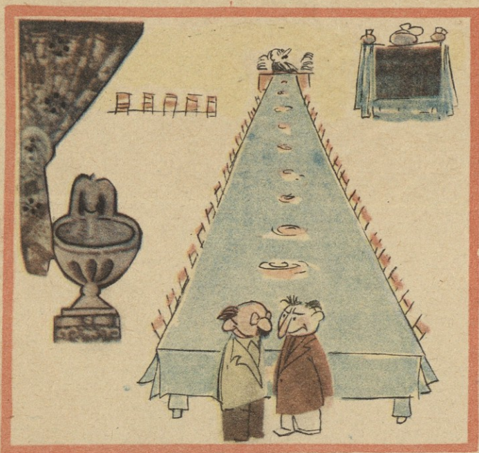
— რა ამბავია ამ სიბრძნე კაბინეტი? — სათოფრეზე არ იპარებხ კაცს.