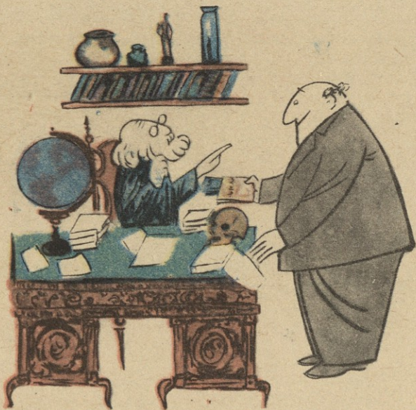
— ატმსტატში რა ნიშნები აქვს? — სულ ტკიცინა ხუთიანები, გატონო! — მე ატმსტატზე გეკითხებით, მაგ ნიშნებით ციხეში მოხვლებით.