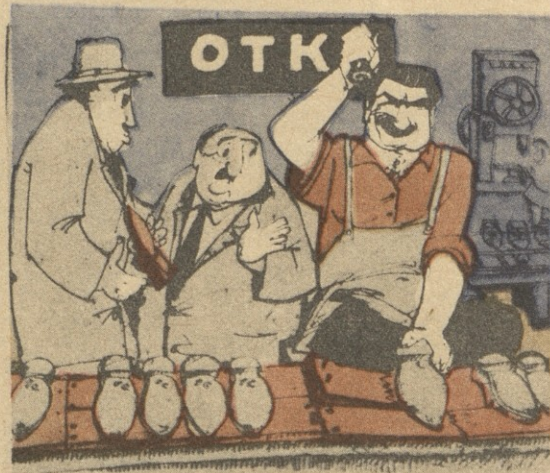
— რამ დაშალა ეს ფეხსაცმელი? — სულ ოთხჯერს ბრალია: ისე მავრა ურთავს I ხარისხის გეჰელს, რომ ვეღარ შეღებს.