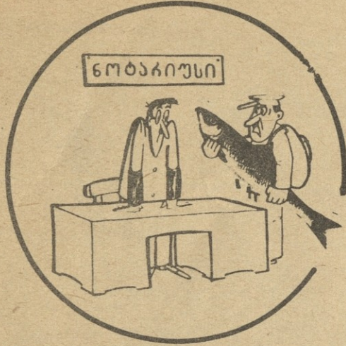
— თუ ძმა ხარ, დამიღოწმე, რომ ამხელ ტყვენი დაეპყრო!