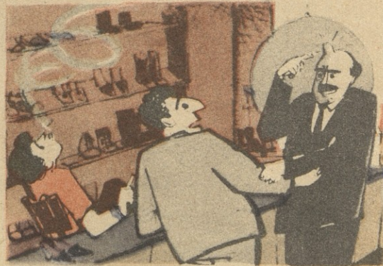
— რაა, კაცო, ამ სიმალეა კოჩი?! — თქვენ რომ სახლში ცოლისთვის ფეხსაცმელი გაგატანათ, იმისი ქუსლის ზომას.