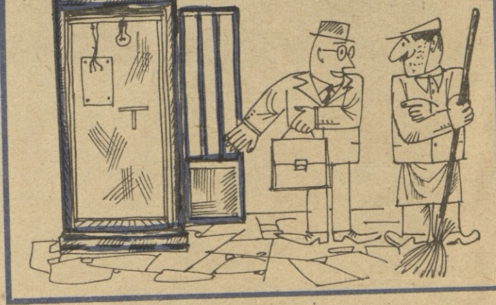
ნახ. ჯ. ლოლუასი

— რატომ მოხსნეს ეს ტელეფონი? — რატომ და ფულის აღების მემს, არაჰმარს არ აკეთებდა!