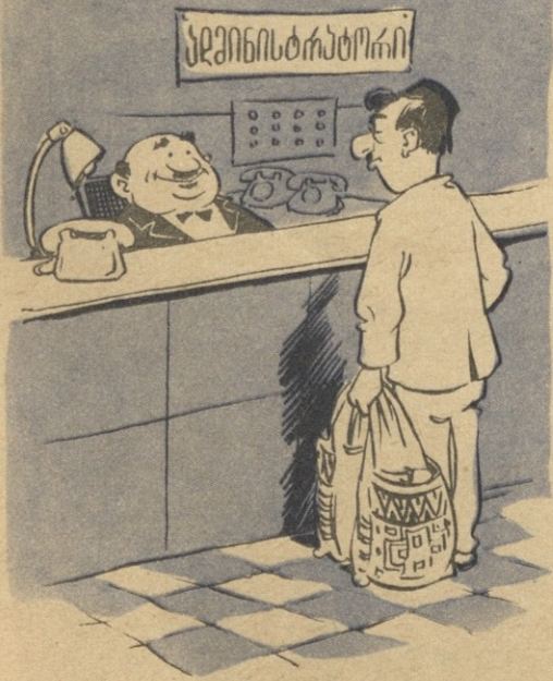
— მოგჩანდით სტუმარი ღვთისა... — ღვთის კი არა, სპეცინსტრატორისა, მთელი სასტუმრო თქვენს ხელშია.

ერთი გასროლით ორი კურდღელი მოკლავო, სწორედ ჩემზე იოქმება: