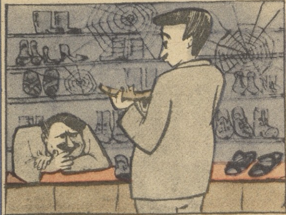
— ამ მხინჯ ფეხსაცმელს კიდეც ფეხების დამახინჯება უნდა?!