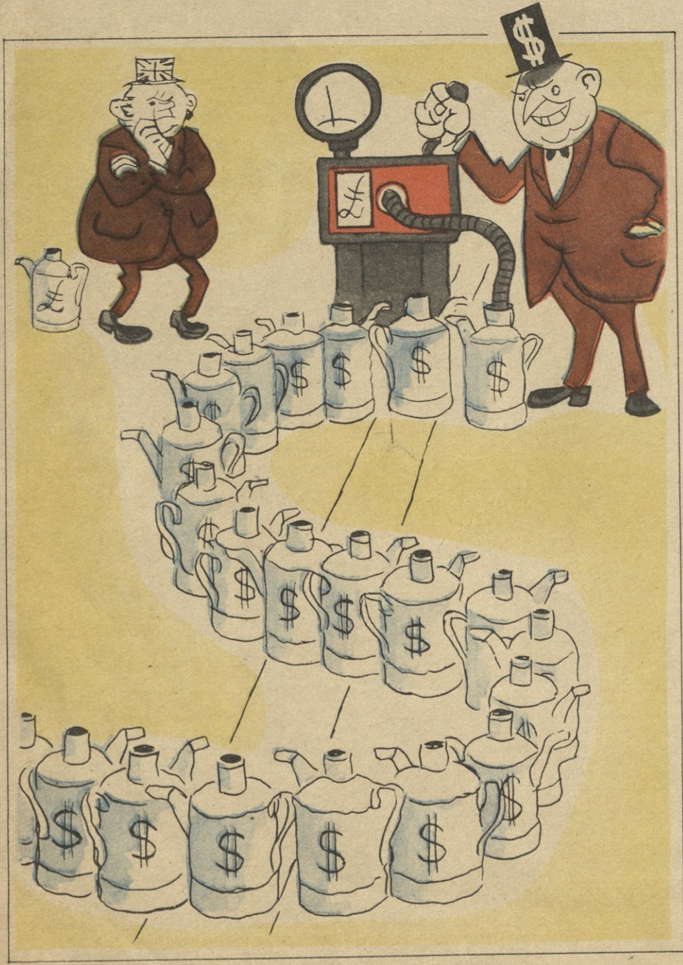
ნახ. გ. ლომიძისა