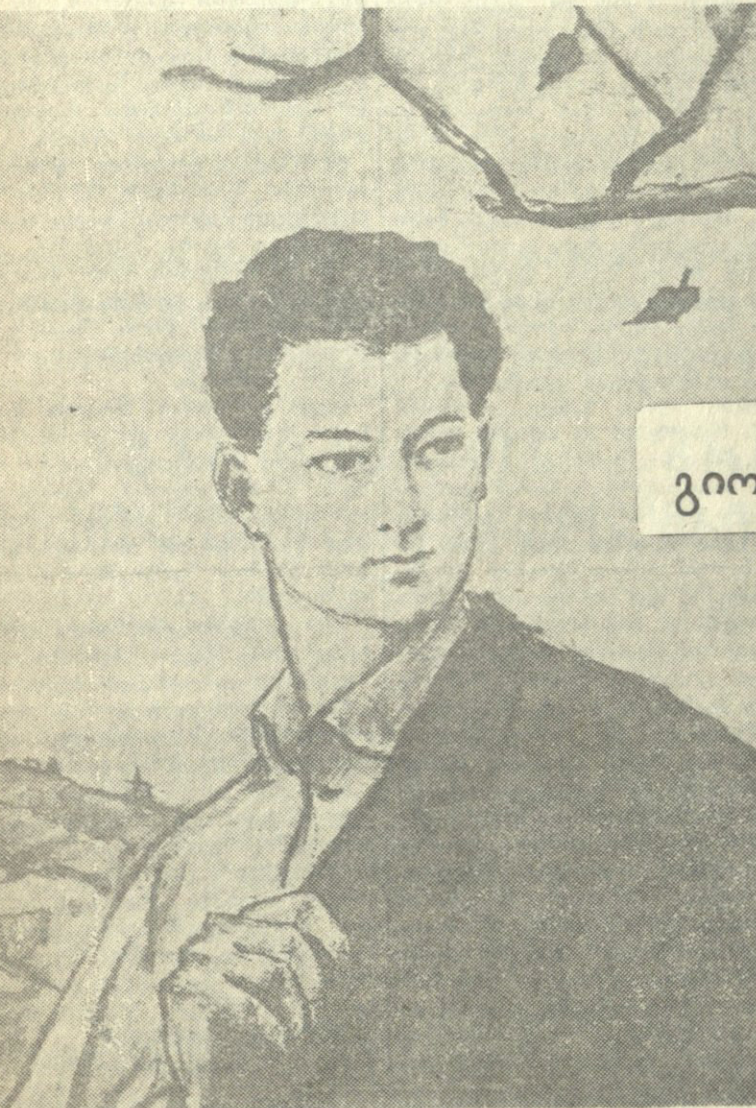
კეთისი, 1939 წელი.

მას წინათ ბოლნისის რაიონულ საბჭოში გაგზინი სიტყვის ისტორია. მას წინათ ბოლნისის რაიონულ საბჭოში გაგზინი სიტყვის ისტორია. მას წინათ ბოლნისის რაიონულ საბჭოში გაგზინი სიტყვის ისტორია. მას წინათ ბოლნისის რაიონულ საბჭოში გაგზინი სიტყვის ისტორია.