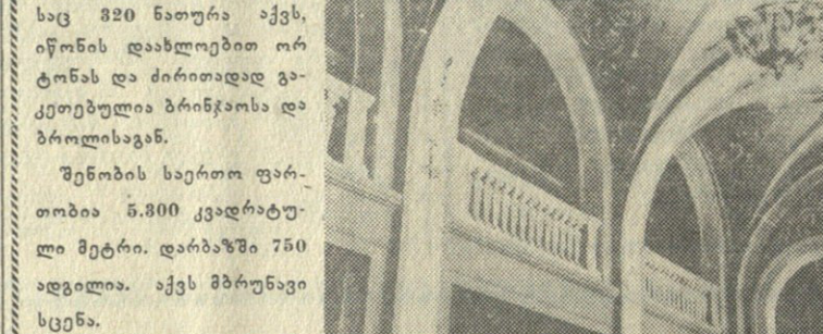
კულტურის სახლის მე-3 სართლის ფოტო.