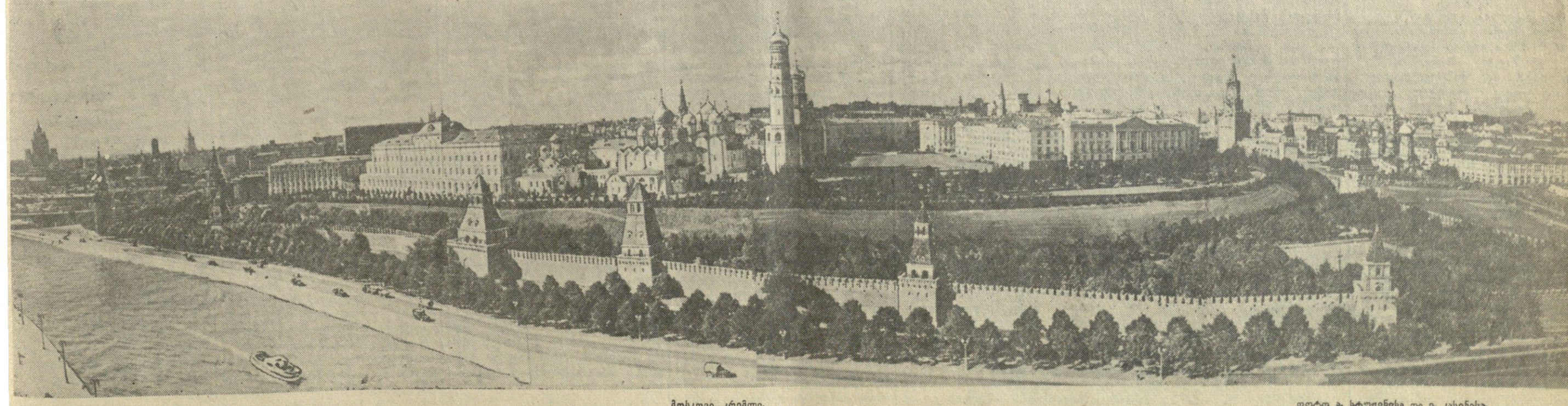
მოსკოვი, კრემლი.

დასასრულ საზეიმო კრებაზე გამოვიდა ლუი სი-იანი, რომელსაც შეკრებილი გულთბილად შეხ-ვდნენ. (საკდესი).