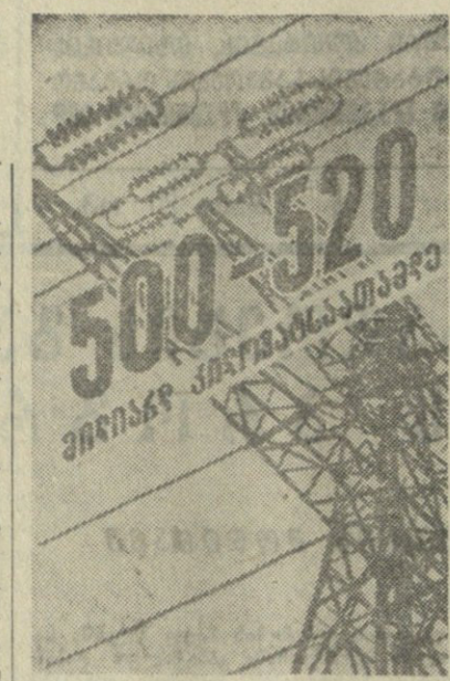
1965 წელს ელექტროენერჯის გამოშვება ჩვენს ქვეყანაში გაიზარდება 500-520 მილიარდ კილოვატსამდე. ი. ა. 2-2-2-ჯერ, ელექტროენერჯის დაღწეული სიმძლავრე გაიზარდება ორჯერ და მეტად.

მოთხოვნილებების სწრაფი განვითარების მნიშვნელოვანი ნაბიჯი აღმოჩენა — ამოცანაა მრეწველობის განვითარების მიზალ ტემაზე უნივერსალური და წამყვანი დარგის — განვითარების მიზალ ტემაზე.