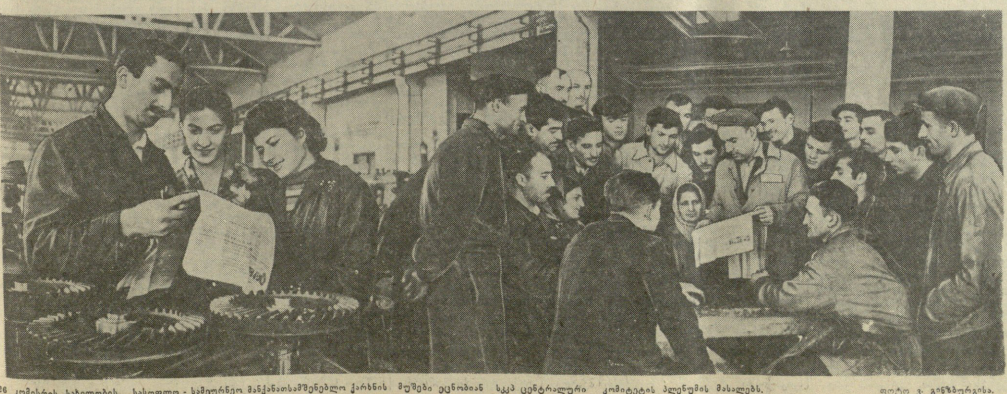
26 კომისიის სახელობის სასოფლო-სამეურნეო მანქანათმშენებლო ქარხნის მუშები ეცნობიან სსრ ცენტრალური კომიტეტის პლენუმის მასალებს.

18 ნოემბერს სსრ კავშირის მინისტრთა საბჭოს თავმჯდომარე ნ. ს. ხრუშჩოვმა მიიღო ინდოეთის იურისტთა დელეგაცია, რომელიც საბჭოთა კავშირში იმყოფება სსრ კავშირის უმაღლესი სასამართლოს მოწვევით. დელეგაციის შემადგენლობაში, რომელსაც მეთაურობს ინდოეთის იურისტების მინისტრი აშოკ კუმარ სენი, შედიან თვალსაჩინო ინდოელი იურისტები ნ. ჩატურჯი, ჩ. პატეტი, რამანი, ს. აჩარია, ს. კ. მუტურჯი, მ. მ. ვაიკუნი, გ. მ. მატური, ბ. დასი, ი. კუმარი.