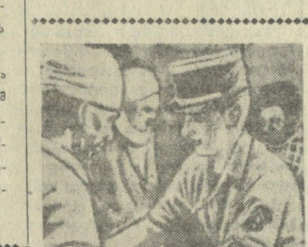
არჩევნების სფეროში ცხადყოფის ბუნებრივი დამოკიდებულების უპირატესობა