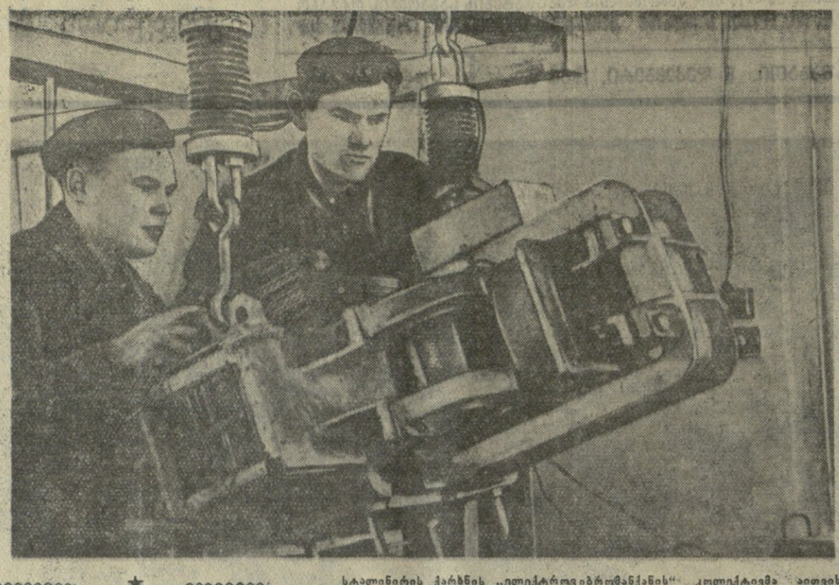
სტალინის ქარხნის ელექტროგონიომანიას კომპლექსში აიჭივება ახალი 500 ვოლტი სიმძლავრის ელექტროგონიომანიის გამაფრინველი. ეს მანქანები ფართოდ იქნება გამოყენებული სამთავრო სამრეწველო მუშაობისთვის. მანქანები შეიქმნა საქართველოს მეცნიერებათა აკადემიის მეცნიერების განყოფილების მიერ.

საბჭოთა კავშირის კომუნისტური პარტიის ცენტრალური კომიტეტის მიხედვით, საქართველოს მრეწველობის განვითარების მიზნებისთვის განხორციელდა უნდა გავარაუდოთ სწრაფად და გავრცელებულად განვითარდეს საქართველოს მრეწველობის განვითარების მნიშვნელოვანი მიმართულებები.