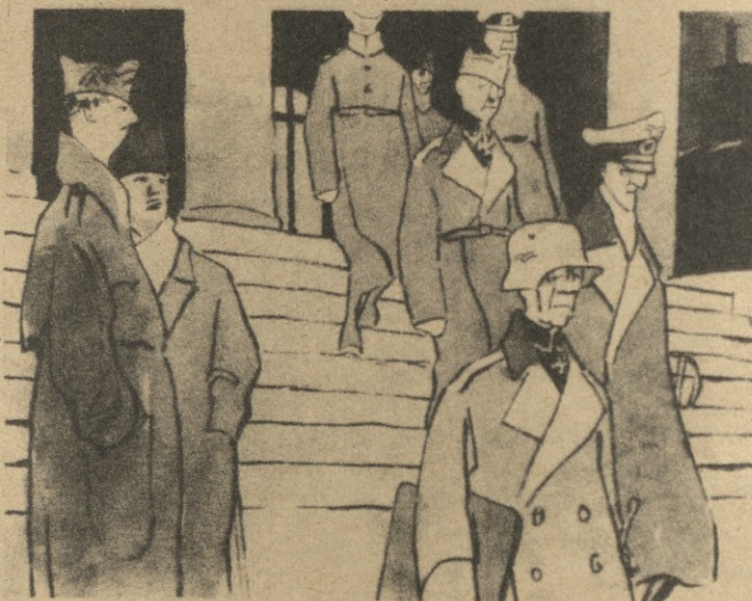
— ეს გენერლები, თავიანთი წარსულის გამო, წინათ ციხეში იხსლნენ, ახლა საპენიტენციოებში სხედან.