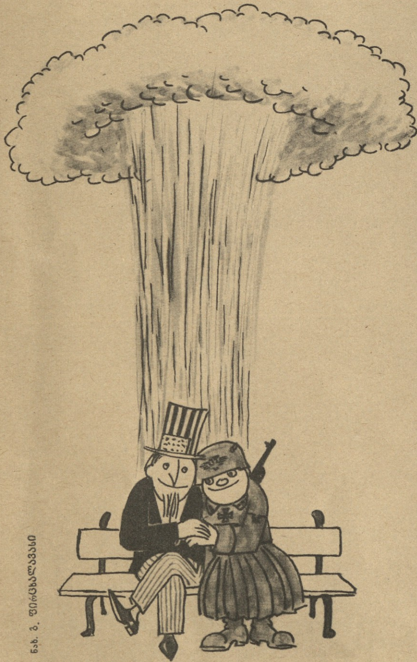
ნახ. ბ. ფიცსლანდისი