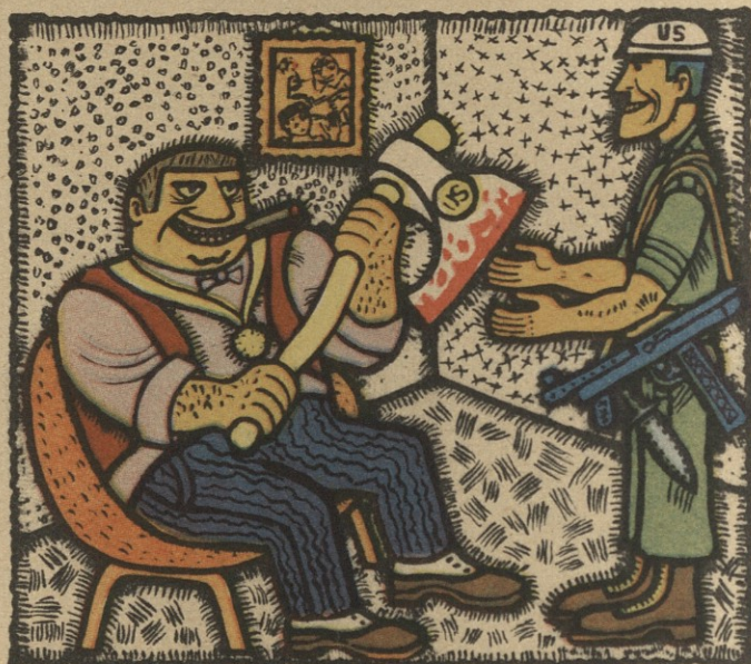
— აბა, შენ იცი, შვილო, თუ არ შეგარცხვენ ვიეტნამში!