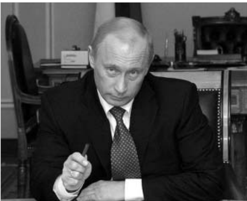
რუსეთი სულ უფრო და უფრო საშიში ხდება დანარჩენი მსოფლიოსთვის.