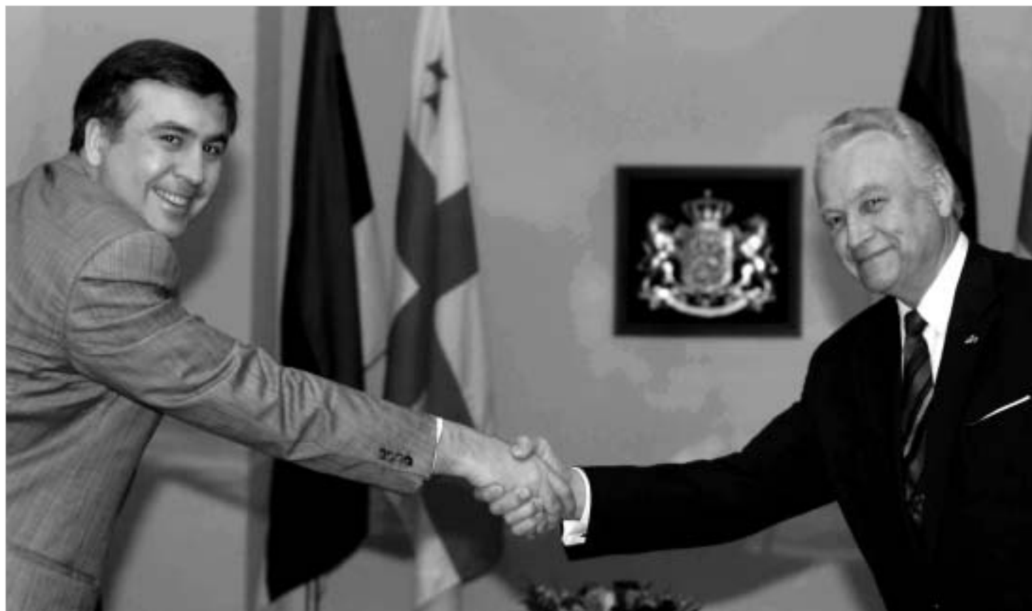
ესტონეთი საქართველოს ინტერესების გამაგრებელი იქნება ნატო-სა და ევროკავშირში.

ესტონეთი, როგორც საქართველოს პარტნიორი სახელმწიფო, ევროკავშირისა და ნატო-ს ფარგლებში საქართველოს ინტერესებს ატარებს და იცავს, - ასეთი განცხადება გააკეთა საქართველოს საგარეო საქმეთა მინისტრმა გელა ბეჟუაშვილმა გუშინ ესტონეთის პრეზიდენტის არნოლდ რუუტელის ოფიციალური დახვდენის ცერემონიის დასრულების შემდეგ.