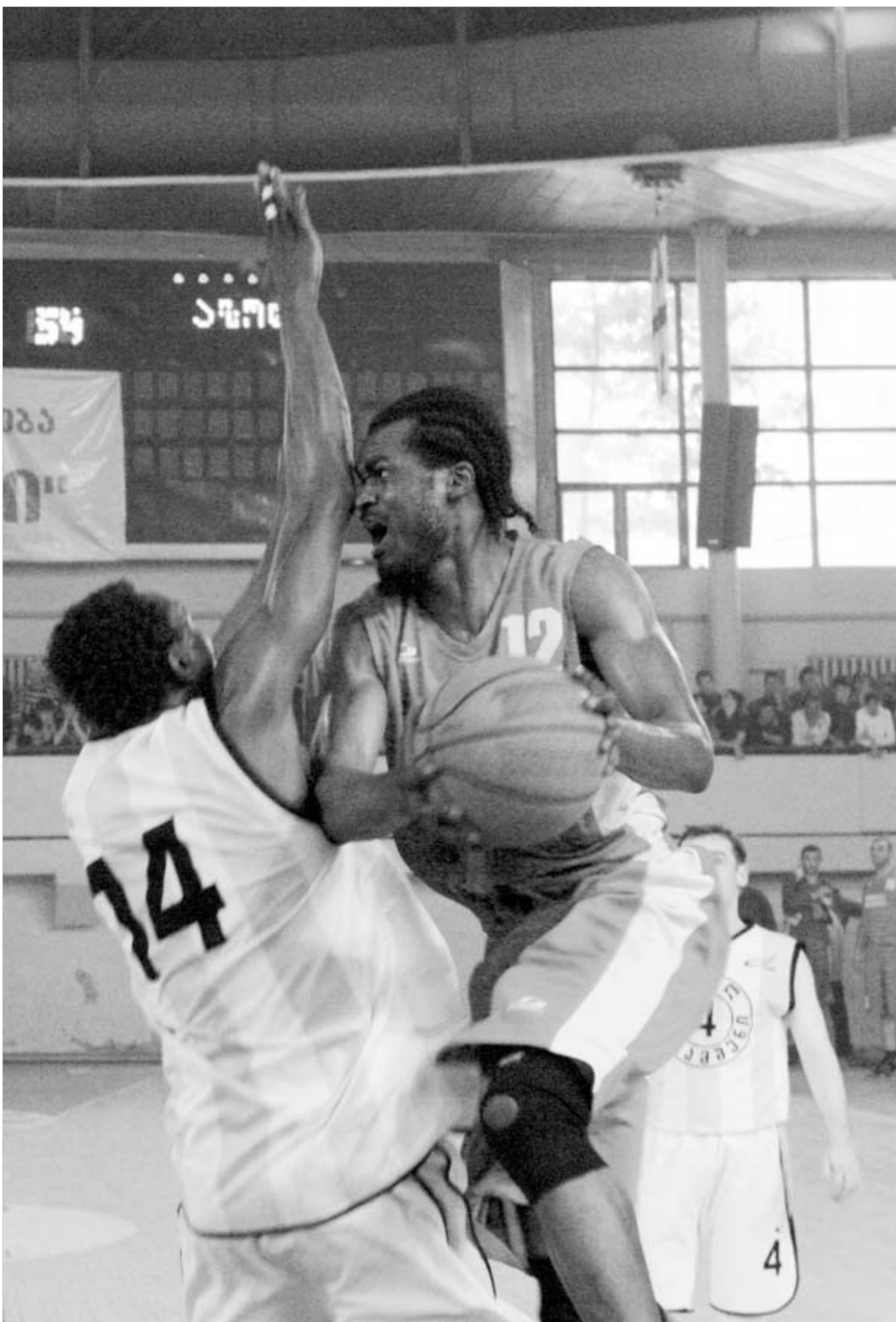
არც ერთი "ავიამშენი" და არც მეორე "მეტალურგი" - ორივე ბედკრული აფრიკის შეილები არიან.