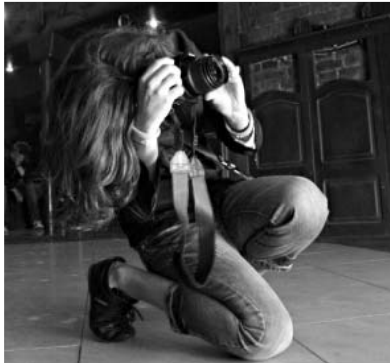
ქურნალ „ოხონს“ აქვს პერსპექტივა ასეთი შტაბით.