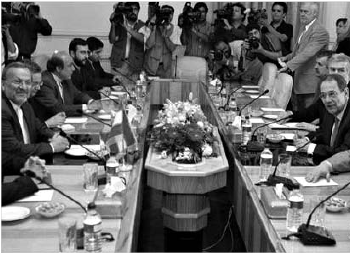
ხაიერ სოლანამ თერანში მშვიდობის შენარჩუნების „ბოლო“ მანია ჩიტიანა.

ხაიერ სოლანას განცხადებით, დასავლეთს სურს ირანთან ახალი ურთიერთობები და თანამშრომლობა, რა თქმა უნდა, იმ შემთხვევაში, თუ თერანის მხრიდან ადეკვატური მიდგომა იქნება.