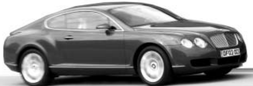
Bentley ძვირად ღირებულ კაპის ბაზოცემას

კომპანია Bentley-ის ხელმძღვანელობა ახალი საშუალო ზომის და ძვირად ღირებული კუპეს გამოშვების შესახებ გაცემულ ინფორმაციას ოფიციალურად ადასტურებს. ახალი ავტომობილი კაბრიოლეტ Bentley Azure-ის ბაზაზე შეიქმნება და ბაზაზე 2009 წლისთვის გამოვა. კომპანიის წარმომადგენლები აცხადებენ, რომ მათ ახალ ავტომობილს კონკურენციას მხოლოდ Porsche Panamera და Lamborghini-ის ანალოგიური მოდელები გაუწევენ. ახალი კუპეს ორიგინალი იმაში მდგომარეობს, რომ მას აქვარად სპორტული იმიჯი ექნება, მაშინ როცა, Bentley მაქსიმალურად კომფორტულ და პრესტიჟულ მარკად ითვლება.