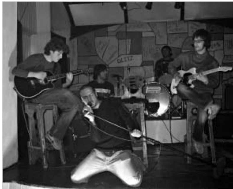
და თ. ისიკ - ჯგუფი „სტრინგი“.

კავკასიისთვის“; იდეა, რომელსაც ერთად განახორციელებენ როკ-ჯგუფები და მუსიკოს-მემორიალები ისეთი კონფლიქტური და დაპირისპირებული ზონებიდან როგორც არის ჩვენეთ-რუსეთი, საქართველო-აფხაზეთი-ოსეთი, სომხეთი-აზერბაიჯანი. გამომდინარე იქიდან, რომ როკ-მუსიკა დღეს კავკასიის რეგიონში არ არის პოპულარული, ჩვენ ვცდილობთ ამ აქციების საშუალებით და მასმედიასთან მჭიდრო თანამშრომლობით, თანამედროვე ეტაპებით ამ იდეის ხელშეწყობას. ჩვენ მზად ვართ სამომავლოდ ამ აქციების განვითარებისთვის კავკასიის სხვადასხვა ქალაქებსა და რეგიონებში. დღეს კი გთავაზობთ წინა კვირას გამართული საღამოს ფოტორეპორტაჟს.