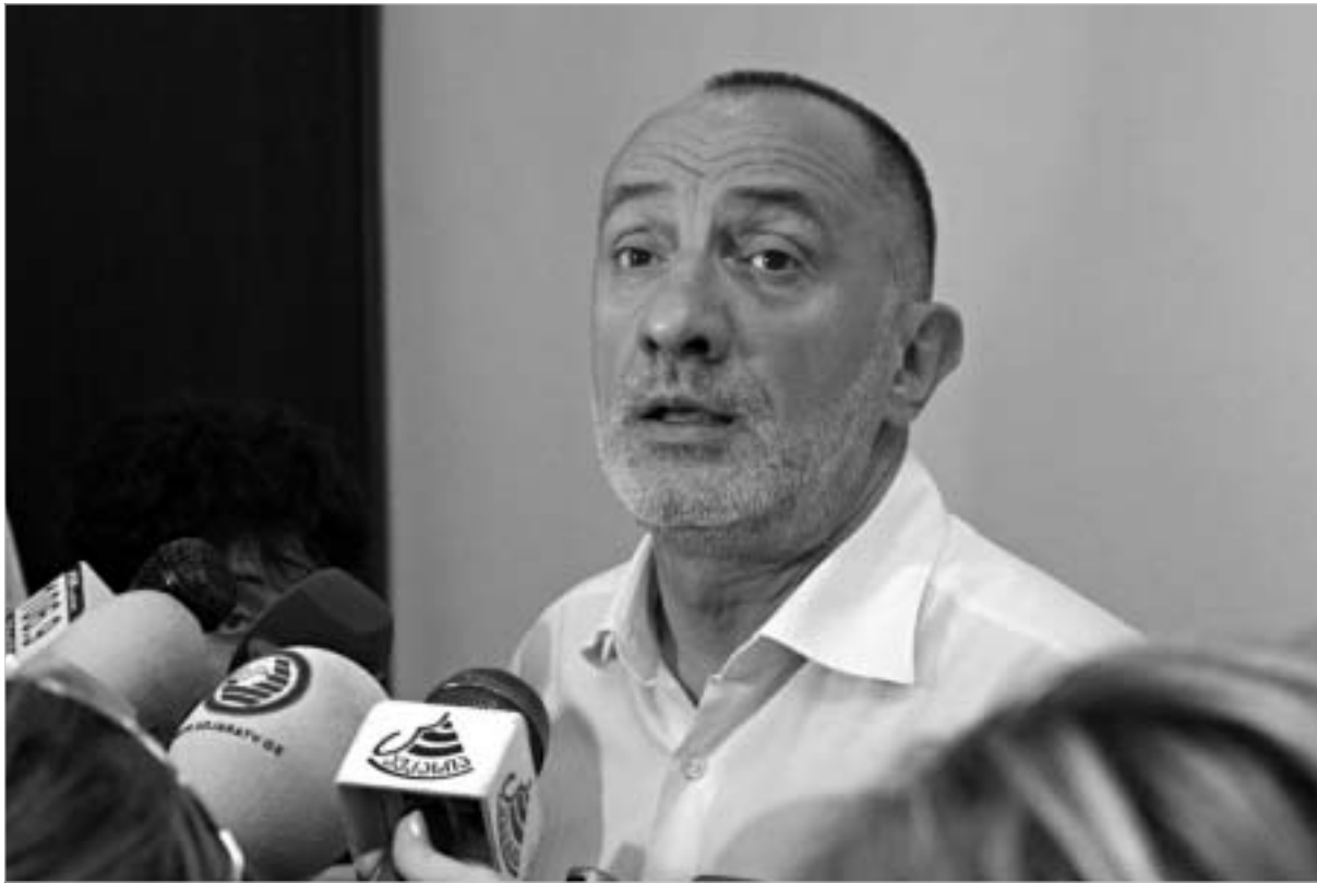
ხაინდრავა მზად არის. პირადად ჩავიდეს მოსკოვში და შეხვედრები გამართოს სახელმწიფო სათათბიროში.

იგი ქართულ-აფხაზური ურთიერთობების თემასაც ეხება: „ქართულ-აფხაზური მოლაპარაკებებით იქმნება პოზიტიური ფონი. როდესაც რუსეთ-საქართველოს ურთიერთობები დარეგულირდება, და ეს ადრე თუ გვიან აუცილებლად მოხდება, უკვე იარსებებს წინაპირობა იმისა, რომ ქართულ-აფხაზური დიალოგი წარმატებული იყოს. მაგრამ თუ არ იქნება დაძლეული რუსეთის წინააღმდეგობა, მხოლოდ ქართულ-აფხაზური მოლაპარაკებები შედეგს ვერ მოიტანს.“