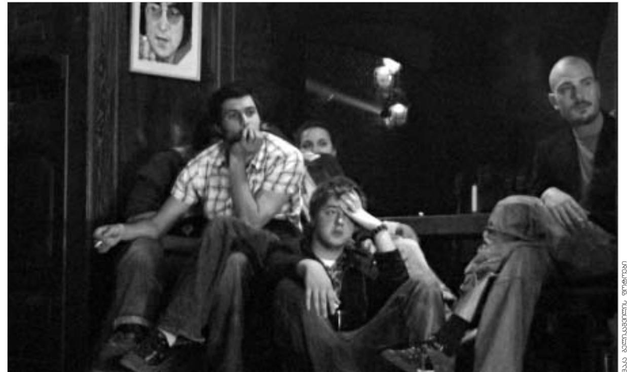
ჯგუფ „სტრინგის“ ფანები მოლოდინში.