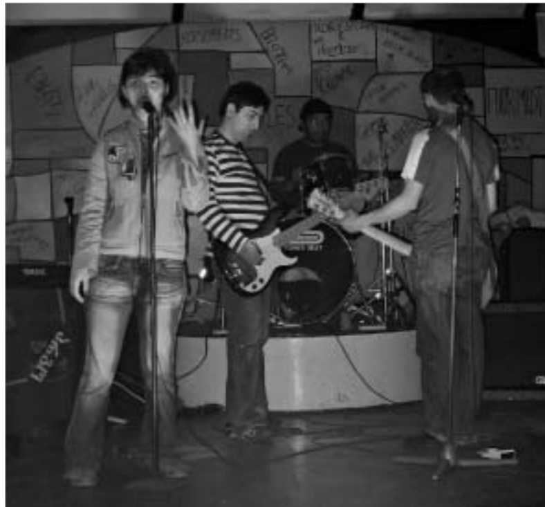
ჯგუფი „ტეტანუსი“ რუსთავიდან.