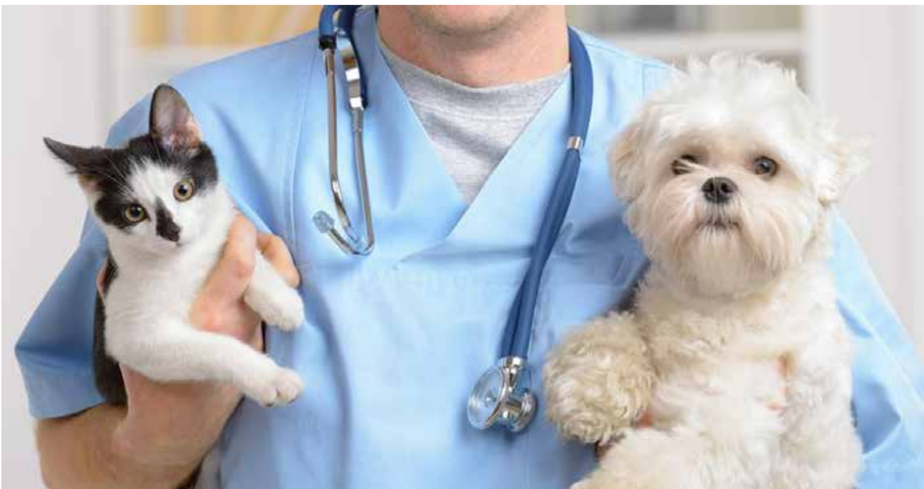
მიუსაფარი ცხოველების პრობლემა – ინტეგრირებული ვეტერინართან

– ამ პრობლემის გადაჭრა რთული და გრძელვადიანია, მაგრამ არა – შეუძლებელი. ცხოველებში დაავადებების შესამცირებლად, სხვადასხვა დაავადების პროფილაქტიკის მიზნით, მედიკამენტებსა და ღონისძიებებს იყენებენ. ძაღლისა და კატის ვირუსულ