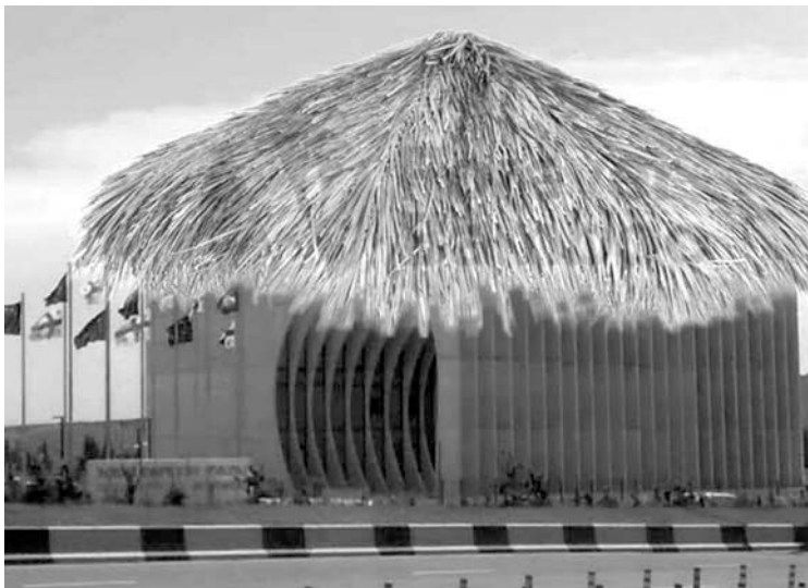
5 გზ. —>

— „აი-რაიმ“ აჩემებული აქვს: კვლევები უნდა ვატაროთ. აქ ერთი მომენტიც არის გასათვალისწინებელი: „აი-რაიმ“ იქნება, „საერთაშორისო გამჭვირვალობა“ თუ სხვა არასამთავრობო ორგანიზაციები, ყველა უცხოეთიდან ფინანსდება. როცა შეკვეთას იღებ, საკუთარი თავი წარმოაჩინო, ვიდაცას იმიჯი შეუქმნა, სხვა რა გზა გრჩება? — მაქსიმალურად უნდა შეეცადო, იგი ისეთ პერსონაჟს შეადარო, რომელსაც მართლაც დიდი რეიტინგი, საზოგადოების მხრიდან პატივისცემა და ერთგვარი რენომე აქვს. ივანიშვილი, რომელიც უდიდესი ქველმოქმედი, ქვეყანაში დიდი რეიტინგით სარგებლობს. მან ქვეყანა მასხარა და სადისტი ნაცებისგან გაათავისუფლა. „აი-რაიმ“ ივანიშვილზე მაღლა ეს ურეიტინგო