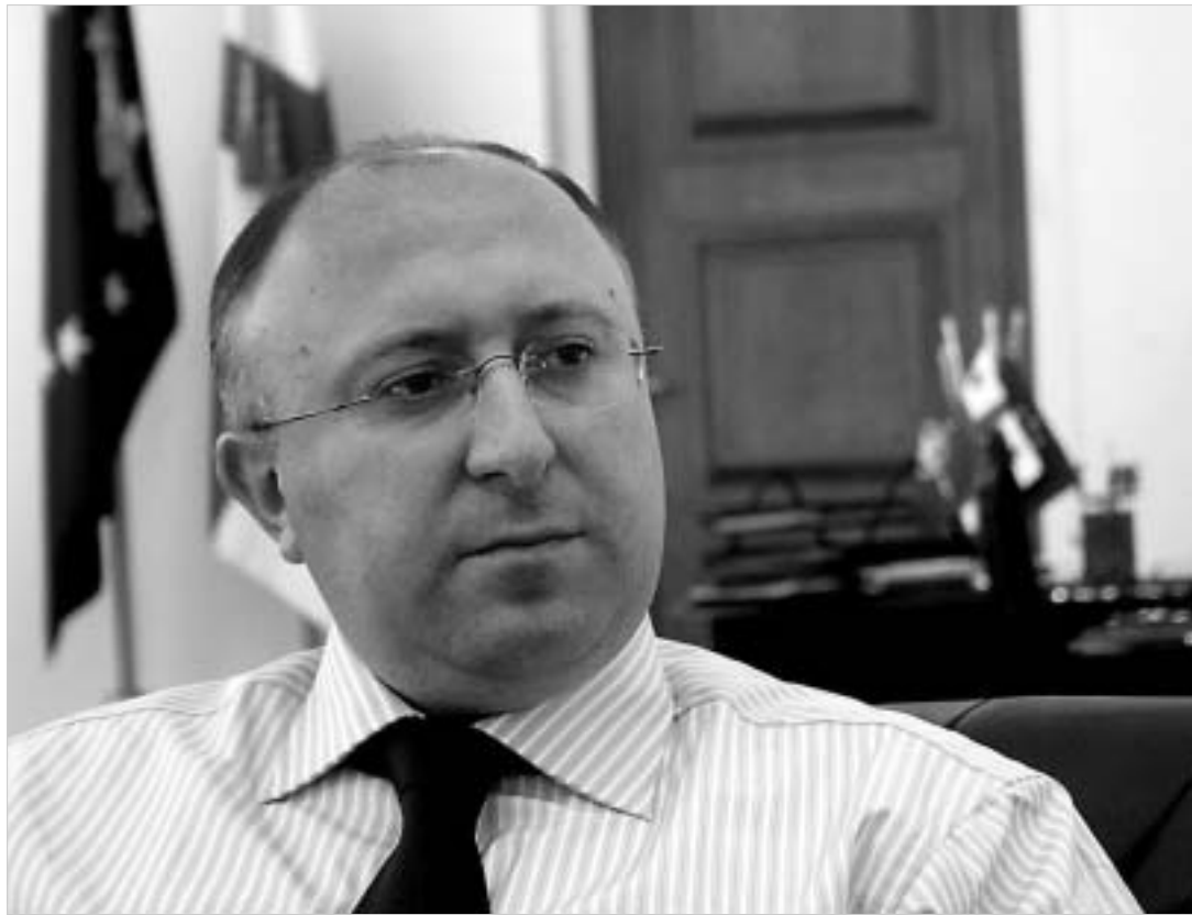
გაზეთი 24 საათი