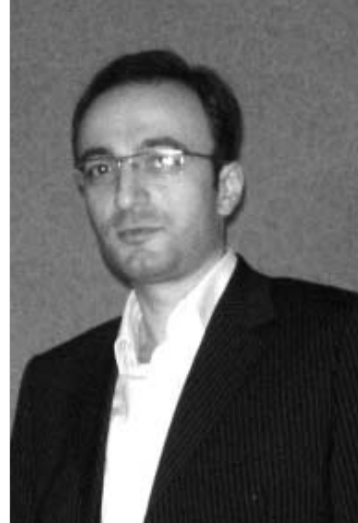
თბილისის პალატის პრეზიდენტი გიორგი მარგველაშვილი