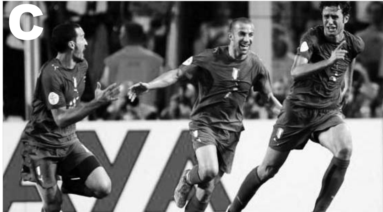
დელ პიეროს მეორე გოლი.