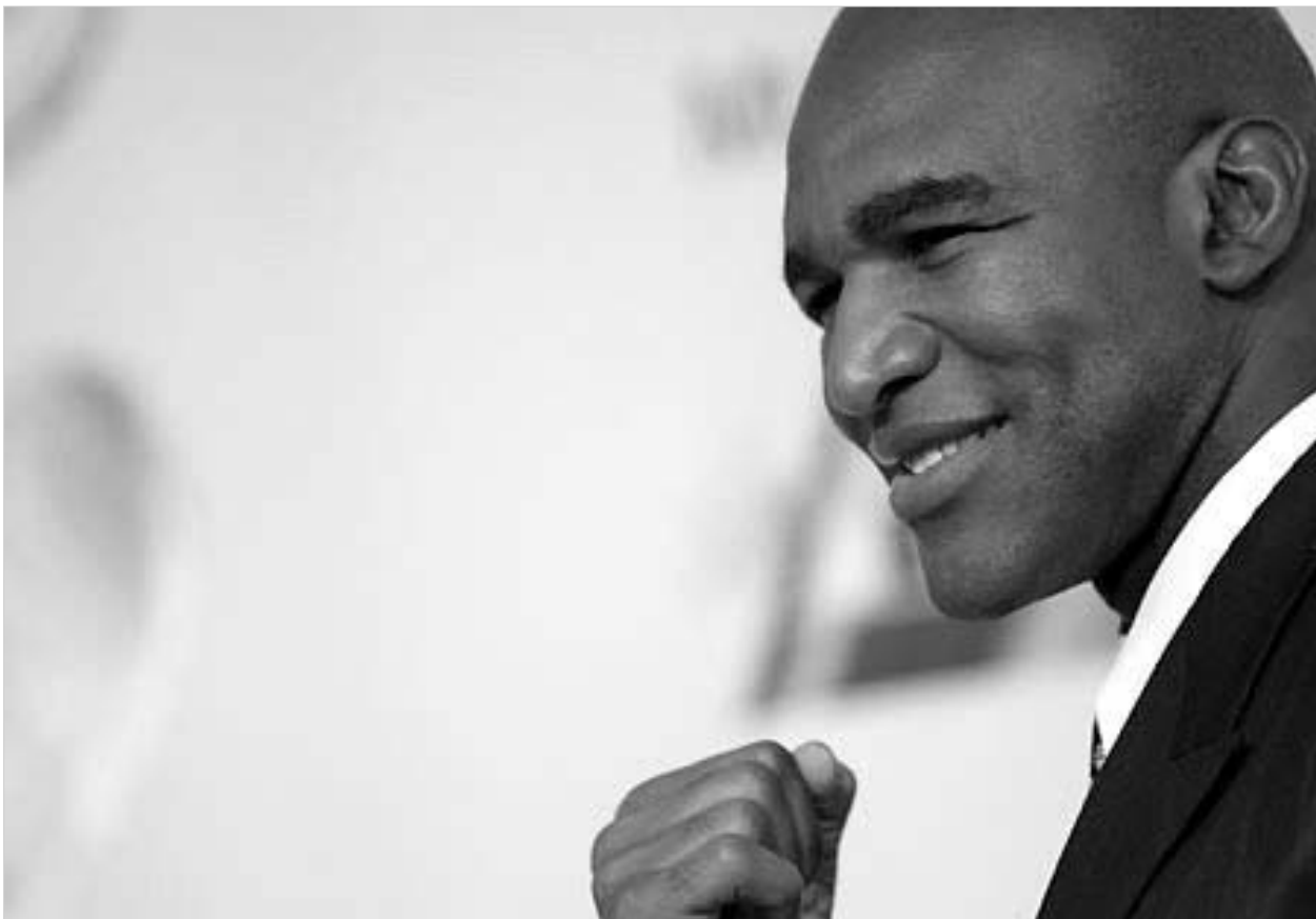
ჰოლივუდმა კარგად იცის მძიმე ნონაში მუშტის ძალა.

ლარი დონალდთან დამარცხდა. მანამდ ორჯერ იხერხა მარცხი - 2003 წლის 4 ოქტომბერს ჯეიმს ტონისთან და 2002 წლის 14 დეკემბერს ერთსულელოვანი გადაწყვეტილებით