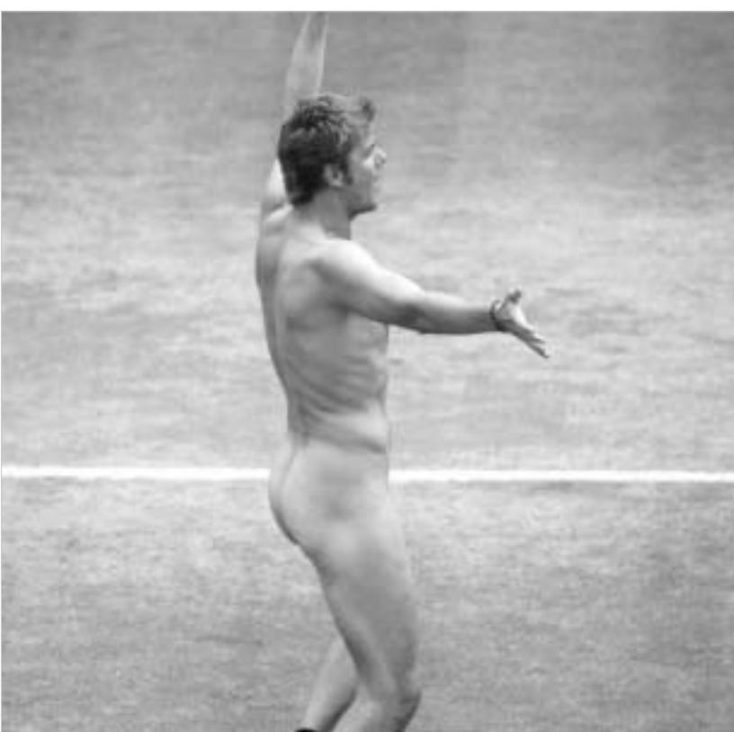
მამაკაცი სტრიკებით უიზღდონს.

"შესაძლოა, მას რაიმე პრეტენზია აქვს პირადად ჩემთან, - ამბობს ტურსონოვი, - არ ყოფილა შემთხვევა, რომ მას ჩემი მატჩი ემაჯავროს და ჩვენ არ გვეკამათოს. უბრალოდ საშიშელია. თუ ადამიანი იგებოდა ტაშის ფონზე დატოვა ბოლომდე საშველი არ არის. ყველაფერს ვიტყვი, რასაც მასზე ვფიქრობ. მან იმსაჯა ბოლო სამი მატჩი ჩემი მონაწილეობით და ყოველთვის პრობლემები მექმნებოდა. დეტალებზე აღარ შევიჩერდები. თუმცა, დარწმუნებული ვარ, რომ ძალიან ცუდი მსაჯეა. მარტო