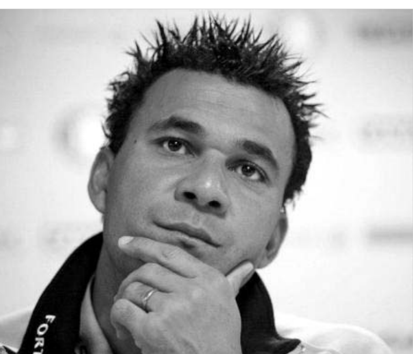
გულიტს მხოლოდ გერმანია მოეწონა

- რა თქმა უნდა, ვიცი. თუ ჩემი აზრი გაინტერესებთ, გეტყვით, რომ ჰოდინკე ილბოანი მწვრთნელი ცხოვრებაში არ მინახავს. მას ალბათ სილადა აქვს დამალული ჩემი სახელი სიდენა ილბოანი ნალი (ცხუმობი). სერიოზულად თუ ვიტყვი, პიდინკი