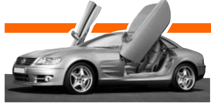
Volkswagen VW Phaeton-ს ადარ გამოუშვავენ

კომპანია Volkswagen-ი ძვირადღირებული სედანის VW Phaeton-ის წარმოებას შეწყვეტს. კომპანიის მიერ გაცემულ განცხადებაში აღნიშნულია, რომ მანქანის მოთხოვნა ვერ აკმაყოფილებს, რომელიც ძალიან უახლოეს მომავალში შევა. კომპანიაში აცხადებენ, რომ ძრავის გადაკეთება და სპეციალური ფილტრის დამონტაჟება საკმაოდ დიდ თანხებთან არის დაკავშირებული.