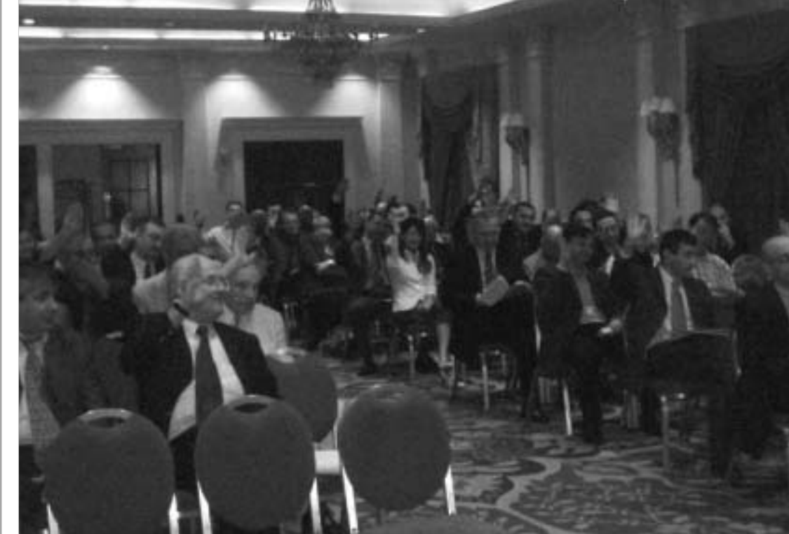
თბილისის რეგიონული საავტორო-სამრეწველო პალატის დამფუძნებელი კრების სხდომა.