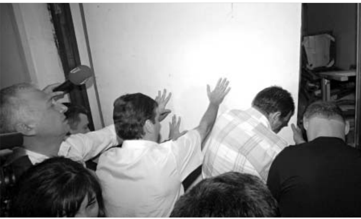
ოპოზიციის ბრძოლა უნივერსიტეტში ხელისუფლების „ზღოკადის“ გასარღვევად