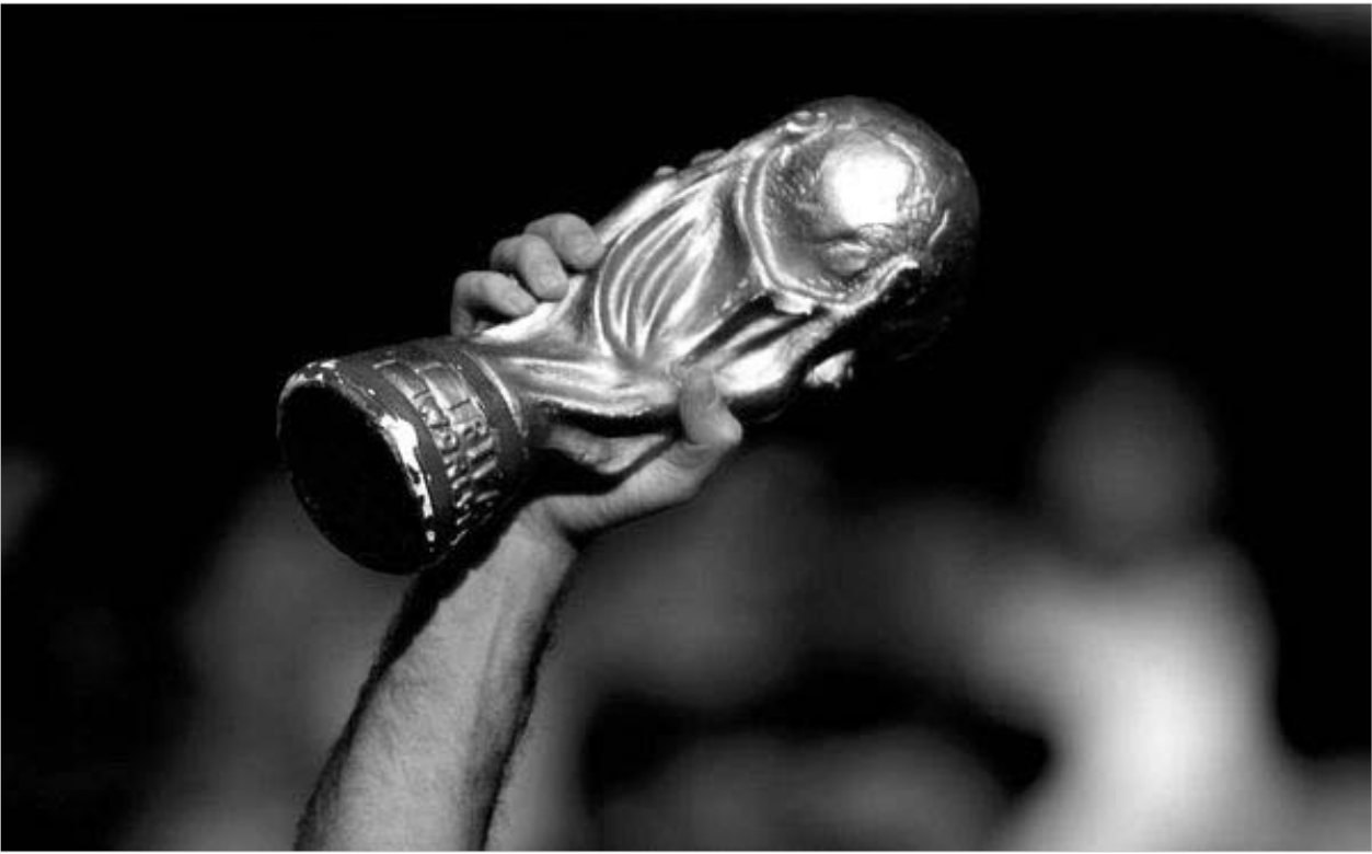
კლენსმანს ჩემპიონობისთვის მილიონ ევროს პპირდებიან.

"ოქროსთვის" მაქსიმალურ პრემიას ინგლისის ნაკრებს დაჰპირდნენ - ინგლისის ნაკრების თითოეული ფეხბურთელი ჩემპიონატზე გამარჯვების შემთხვევაში 600 ათას აშშ დოლარს მიიღებდა. უკრაინა, რომელმაც ინგლისთან ერთად, მეოთხედფინალურ სტადიაზე დაასრულა ჩემპიონატში მონაწილეობა, მას ბევრით არ ჩამორჩენია: გუნდის საერთო პრემია 5 მილიონი დოლარი შეადგინა. გერმანიაში მაჩანჩალებმააც გამოიმუშავეს ფული. ტრინიდადის და ტობაგოს მთავრობამ თავის ფეხბურთელებს და მწვრთნელებს 167-167 ათასი დოლარი გადასცა, ხოლო ანგოლის ნაკრების მიერ გატანილი ერთადერთი გოლის ავტორმა ამაღელვებულ 180 ათას ევროდ შეფასებული სახლი მიიღო საჩუქრად.