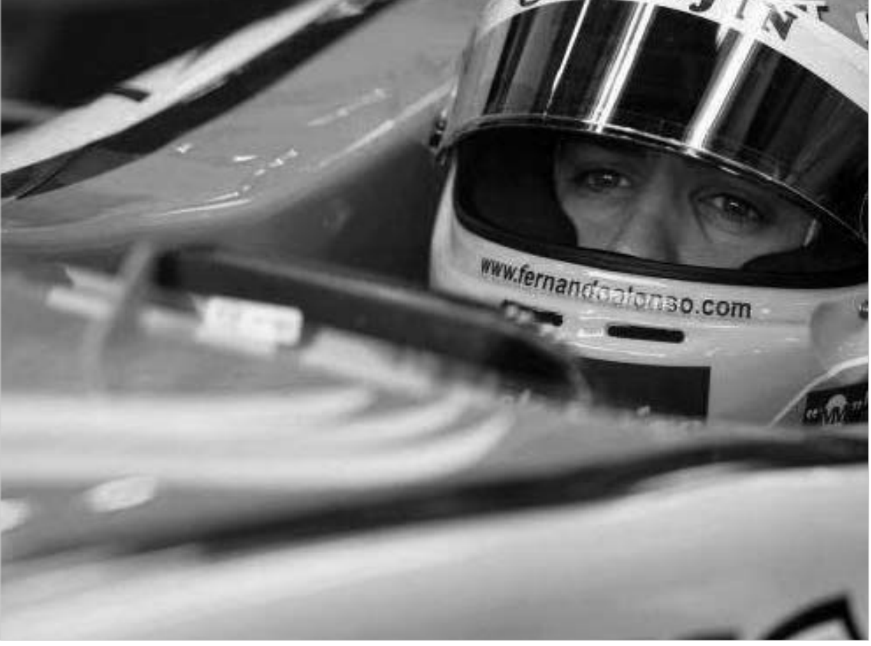
ალონსოს „რენოდან“ გადასვლა-არგადსვლაზე ბევრს საუბრობენ.

ჯერ ერთი, არ მჯერა, რომ მას ამის გაკეთება უნდა. და, საერთოდ, ჩვენი პირობები საკმაოდ მაკარია.“ რაც შეეხება თავად ბრიატორეს, რომელსაც ჰკითხეს, აპირებს თუ არა ალონსოს გუნდში შენარჩუნებას, მან გავრცელებული ხმები უარყო: „არ ვიცი, საიდან ვრცელდება ეს ხმები. ეს ყველაფერი საპირველპიროდ ხმობობას ჰგავს. მე არც ხელშეკრულებაზე ხელის მონერას ვაძიებ ვინმეს და არც მის დარღვევას.“ „საფრანგეთის დიდი პრიზის“ შემდეგ ჩემპიონატის ლიდერსა და მსოფლიოს შედგენის ჩემპიონს შორის ქულაში სხვაობა 19-დან 17 ქულამდე შემცირდა. წინ კიდევ შეიდი რბოლაა.