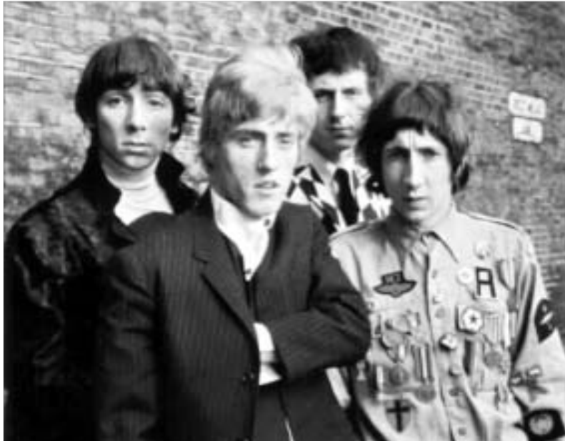
Substitute. მათი როკ-მიუზიკი "ტომი", რომელიც თამაშობდნენ ელტონ ჯონი და როჯერ დალტრი, გახდა ლონდონის უესტ-ენდის სუპერ ჰიტი. 2002 წლის მიწურულს ლევინდარულ ჯგუფში, რომელიც ორი-განაღორი შემადგენლობით გა-

ლევინდარული ბრიტანული როკ-ჯგუფი 20 წლის შემდეგ, 2006 წლის სექტემბერში საერთაშორისო ტურნეს დაიწყო. ჯგუფი აგრეთვე აპირებს ალბომის ჩანერას, რომელიც 1982 წლის სიმღერებზე შევსება და ოქტომბერში უნდა გამოვიდეს. ჯგუფის ტურნე 12 სექტემბერს ფილადელფიაში დაიწყო შემდეგი შემადგენლობით: გიტარისტი პიტ ტაუნშენდი, ვოკალისტი როჯერ დალტრი, დასარტყამი ინსტრუმენტისტი ჯეკ სტარკი (რინგო სტარის ვაჟი), ბასისტი პინო პალადინო, კლავიატურა ჯონი ბანდრიკი და მიკის უმცროსი ძმა სემონ ტაუნშენდი. წლის ბოლომდე ჯგუფი კონცერტებს გამართავს ამერიკაში და კანადაში, ხოლო 2007 წლის დასაწყისში ლათინურ ამერიკაში, ჩრდილოეთ აზიაში და ევროპაში. კონცერტებზე ჯგუფი შეასრულებს სიმღერებს ახალი ალბომიდან და პიტებს Behind Blue Eyes, I Can't Explain და Who Are You. The Who იყო 70-ანი წლების ერთ-ერთი უდიდესი როკ-ჯგუფი. მათ პიტებს შორის შედის: My Generation, Pinball Wizard და