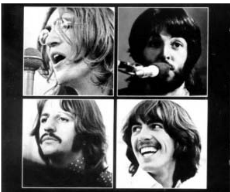
ფირები შეიცვალა "200-სათიან უნიკალურ ჩანაწერებს, რომლებიც ძალიან ძვირად ღირებულა." მისივე თქმით, მათ შორისაა სხვა შემსრულებლების სიმღერები, რომლებიც ფილმისთვის Let It Be ჩანაწერა და სურათის არგამოსუ-ლი ფინალური ვარიანტი.

ლონდონის სასამართლომ პირობით ორი წელი მიუხაჯა "ბითლზის" დაკარგული სტუდიური ჩანაწერების გამოძიებას. პროკურორი, 55 წლის ნაიჯელ ოლევერისთვის 4 წელს ითხოვდა, მაგრამ სასამართლომ გაითვალისწინა ის ფაქტი, რომ ეჭმიტანილი უკვე რამდენიმე წელია ფსიქიატრიკულ მკურნალობაში. ოლევერი, რომელიც 37 წლის ნინ მუშაობდა ლევინდარულ ჯგუფთან, დაიჭირდა ოპერაციის დროს, რომელიც ბრიტანულმა პოლიციამ 2003 წელს განახორციელა. მამის შუა ბაზარზე გამოჩნდა რამდენიმე ჩანაწერი ჯგუფის არქივიდან, რომელიც "ბითლზის" ალბომ Let It Be-ზე მუშაობის დროს შექმნილია. ამჯერად პოლიციამ ნაიჯელ ოლევერი მამის დააკავა, როცა იგი ცდილობდა დაკარგული ჩანაწერები უსაფრთხოების სამსახურის გადაცემული თანამშრომლებისთვის მიეყვინა 250 ათას ფუნტ სტერლინგად. ოლევერის სახლის გაჩხრეკის შედეგად, ამოიღეს არა მარტო საარქივო ჩანაწერები, არამედ რამდენიმე რელიქვია, რომელიც დაკავშირებულია ლევინდარულ ჯგუფთან, მათ შორის ჯორჯ ჰარისონის პასპორტი, რომელიც როგორც იტყობინებიან, 60-იანი წლების ბოლოს იქნა მოპარული.