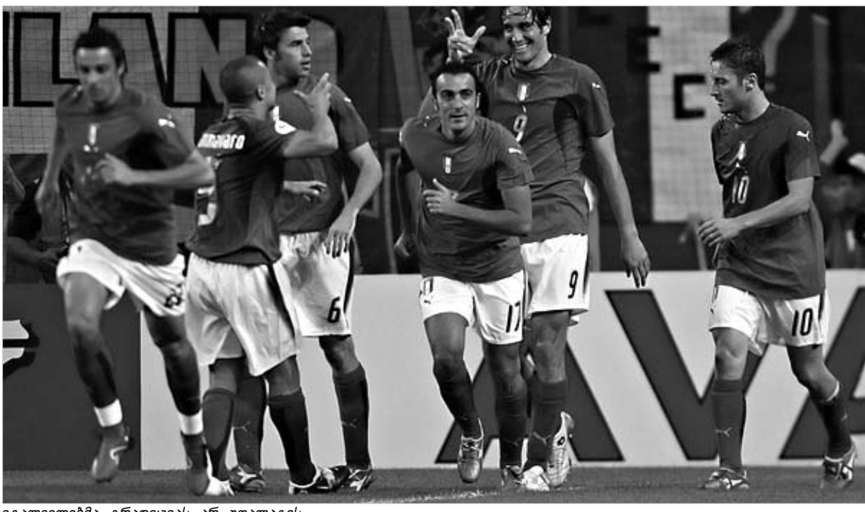
იტალიელებმა ტრადიციას არ უღალატეს.

სააგენტო goal.com-მა შეადგინა განვლილი მუნდიალის მთავარი მოვლენათა და გმირთა მცირე სია. შეიძლება ითქვას, რომ საიტის ჟურნალისტიკა არჩევანი დიდად საკმაოდ არ არის.