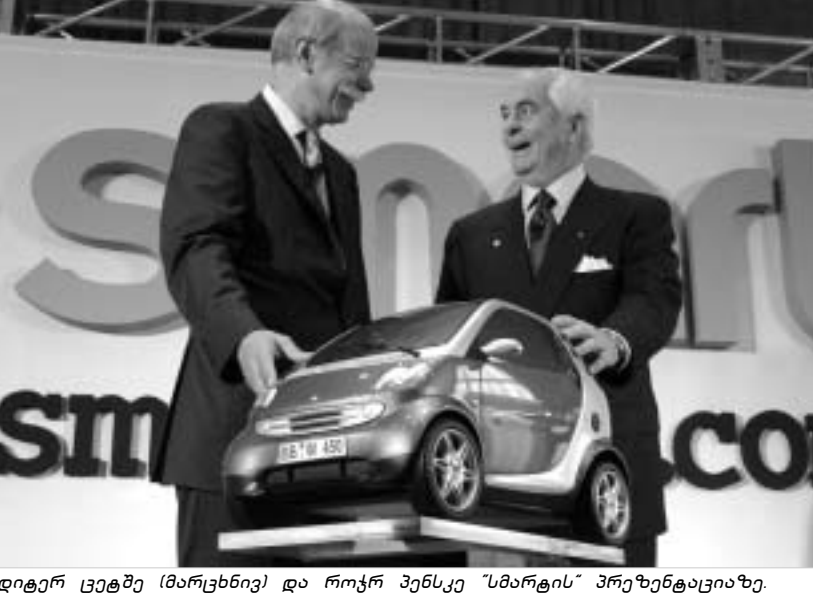
დიტერ ცეტსე (მარცხნივ) და როჯერ პენსკე "სმარტის" პრეზენტაციაზე.

არ მოხერხდა, რომ ახლანდელი მოდელი მეტად წამყვანი იქნებოდა, რეალიზაციის პროცესში კი ახალ ბაზარზე მისი გატანა "დაიმილერ-რაისლერმა" არ ისურვა. "სმარტის" გაყიდვები კიდევ უფრო შემცირდა ამ წლის დასაწყისში. პირველ ხუთ თვეში კომპანია მ სულ 49 400 ავტომობილის გაყიდვა შეძლო, რაც წინა წლის მაჩვენებელთან შედარებით, 21.5-პროცენტით კლებდა. ახალი "სმარტი" ბაზარზე სამი მოდიფიკაციის სახით გამოვა, აშშ-ში და პუერტო რიკოში კი მის რეალიზაციას კისრულობს სადილერი კომპანია "იუნაიტედაუტო", რომელიც ამერიკელ მილიარდერ როჯერ პენსკეს ეკუთვნის.