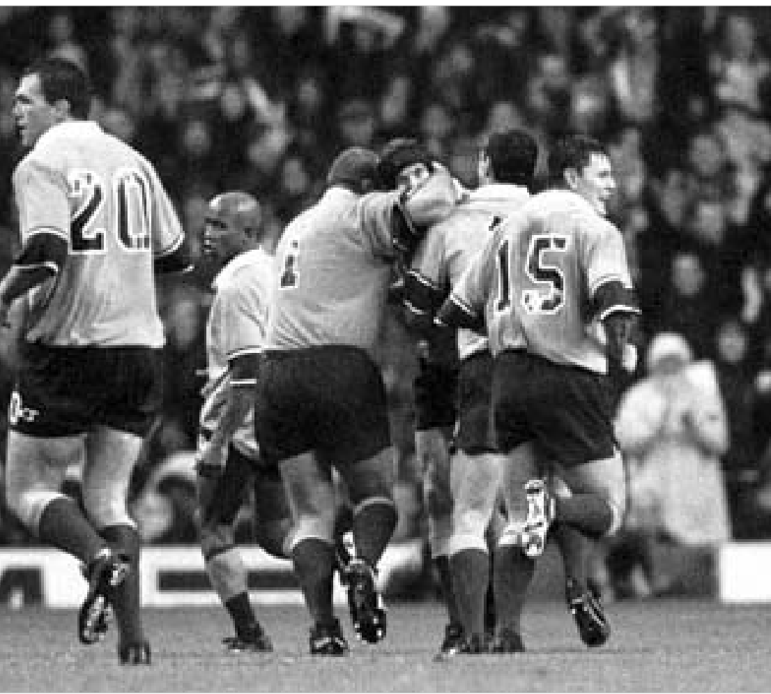
ავსტრალიამ სამხრეთ აფრიკაზე არნახული გამარჯვება მოიპოვა.

სანყისი პინგ-პონგისა და დაზუ-ვარტის შემდეგ ბებერმა სთივედ ლერეემს 1999 წლის მსოფლიო თანსი გაიხსენა და 38 მეტრიდან არეკნი დაკრა. მალე ჩია მულატმა რიკი