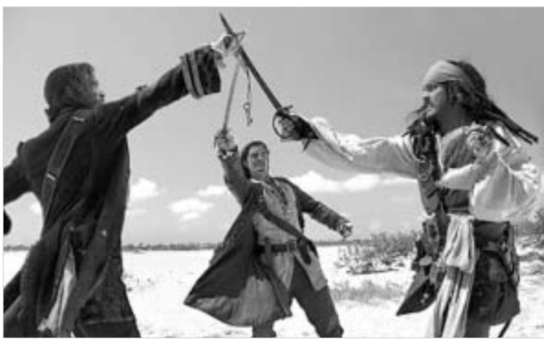
უფლებების დარღვევისთვის მიიღოს ანაზღაურება. თანხა ჯერ არ სახელდება.