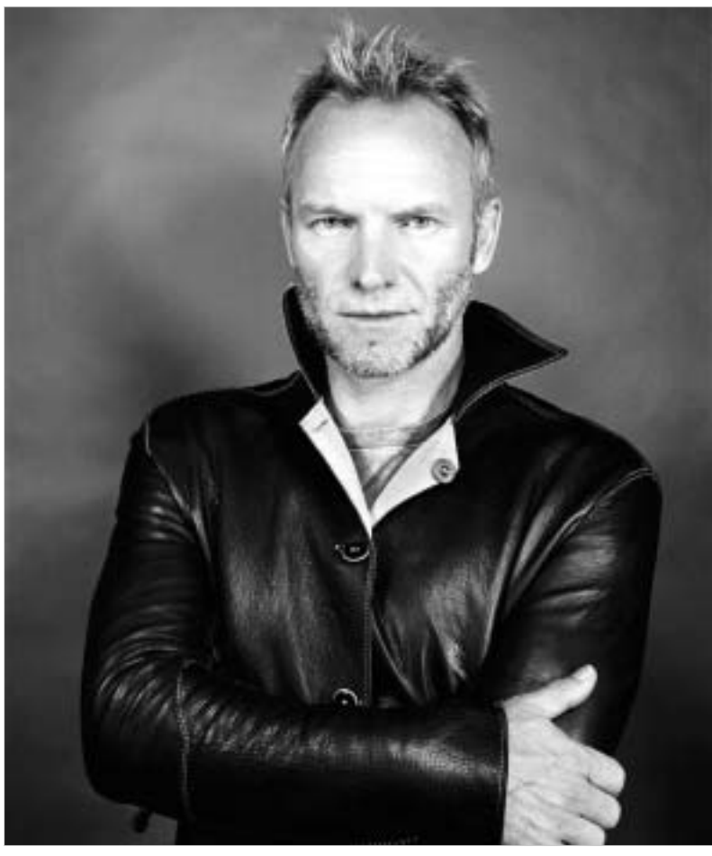
რუსეთის დედაქალაქში ეს მომღერლის მესამე კონცერტია. პირველად იგი 1996 წელს კრემლის სასახლეში გამოვიდა, 2001 წელს კი მოსკოვში ალბომი Brand New Day წარადგინა.

26 ივლისს მოსკოვის სპორტ-კომპლექსს "ოლიმპიკში" დაგეგმილ კონცერტზე სტინგი საკუთარ შვილთან ჯონ სანერთან ერთად გამოვა. როგორც კონცერტის ორგანიზატორების განცხადებით, სტინგი სტინგთან ერთად გამოვა ჯგუფი Fiction Plane-იც, რომლის ვოკალისტი და გიტარისტი სწორედ მისი უფროსი ვაჟია. სტინგი შეასრულებს კომპოზიციებს ალბომიდან Brand New Day. აკომპანიმენტს კი ძველი კომპლექსები და მეგობრები გაუწევენ: გიტარისტი - დომინიკი მილერი და ლაივ უოკმენი, დასარტყამ ისტრუმენტზე დაუკრავს აბე ლაბორიელი, რომელიც ადრე პოლ მაკარტინისთან მუშაობდა.