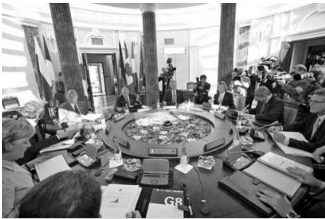
საქართველო პოლიციის დავისკირება რვიანის ლიდერებმა ცხლ-ცხლკე ამჟამბინეს.

დასრულდა "დიდი რვიანის" სამდილიანი სამიტი სანატ-პეტიტორტურგში. უდავოდ, დატვირთული სამუშაო გრაფიკის შედეგად მიღებულია ოცამდე ოფიციალური დოკუმენტი. მასპინძლები თავმოყუნებით აცხადებდნენ, რომ დღის წესრიგის ყველა საკითხზე მიღებული განცხადება, დეკლარაცია თუ კომუნიკე თითქმის შესწორების გარეშე (ან უმნიშვნელო შესწორებებით) მოიწონეს "დიდი რვიანის" ლიდერებმა. სავარაუდოდ, ოფიციალური ბრიფინგების მიღმა მსოფლიოს ყველაზე ძლევაბისილ მმართველთა შორის დაძაბული დიალოგებიც შედგა. "დიდი რვიანის" ლიდერები ყველა საკითხთან დაკავშირებით ერთსულოვნად რომ არ ყოფილან, მოულოდნელი და,