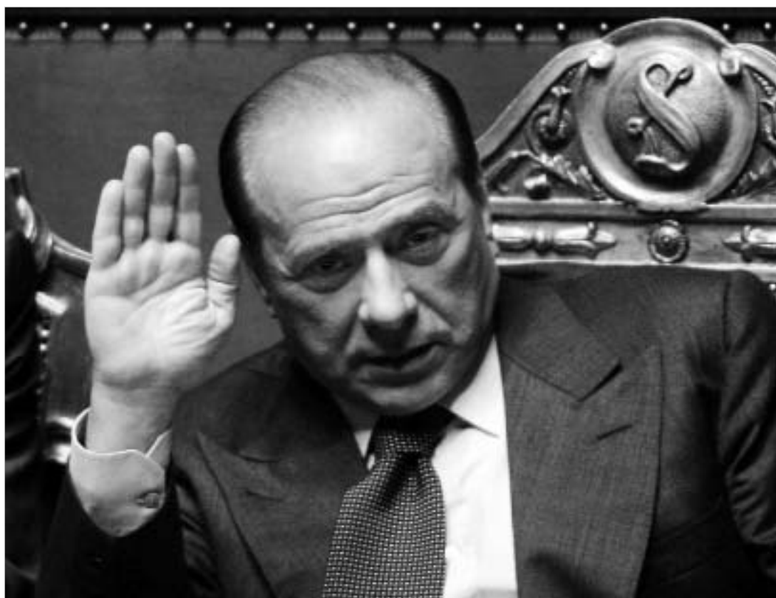
იტალიელთა ანტიამერიკული განწყობის მიუხედავად, ზურულკონი მოკავშირეს კერძოობით არ დაუბრუნებს.