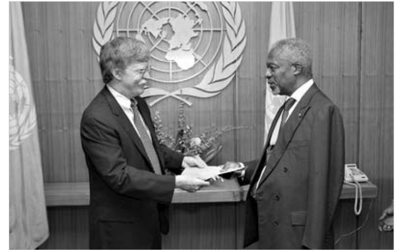
კონ ბოლტონი: ამერიკამ მიიღო ის, რასაც უკანასკნელი სამი თვის განმავლობაში მოითხოვდა.

გაერო-ში მნიშვნელოვან კომპრომის მიღწევის ორგანიზაციის მომავალი წლის ბიუჯეტთან დაკავშირებით. გასულ კვირაში მიღებული გადაწყვეტილებით, უნივერსალური ორგანიზაციის ხარჯები, თავდაპირველად, მხოლოდ 950 მლნ აშშ დოლარი იქნება. გაერო-ს დაფინანსების შემცირებამ, ინიციატივითაა აზრით, ორგანიზაციაში რეფორმირების პროცესი უნდა დაიქაროს.