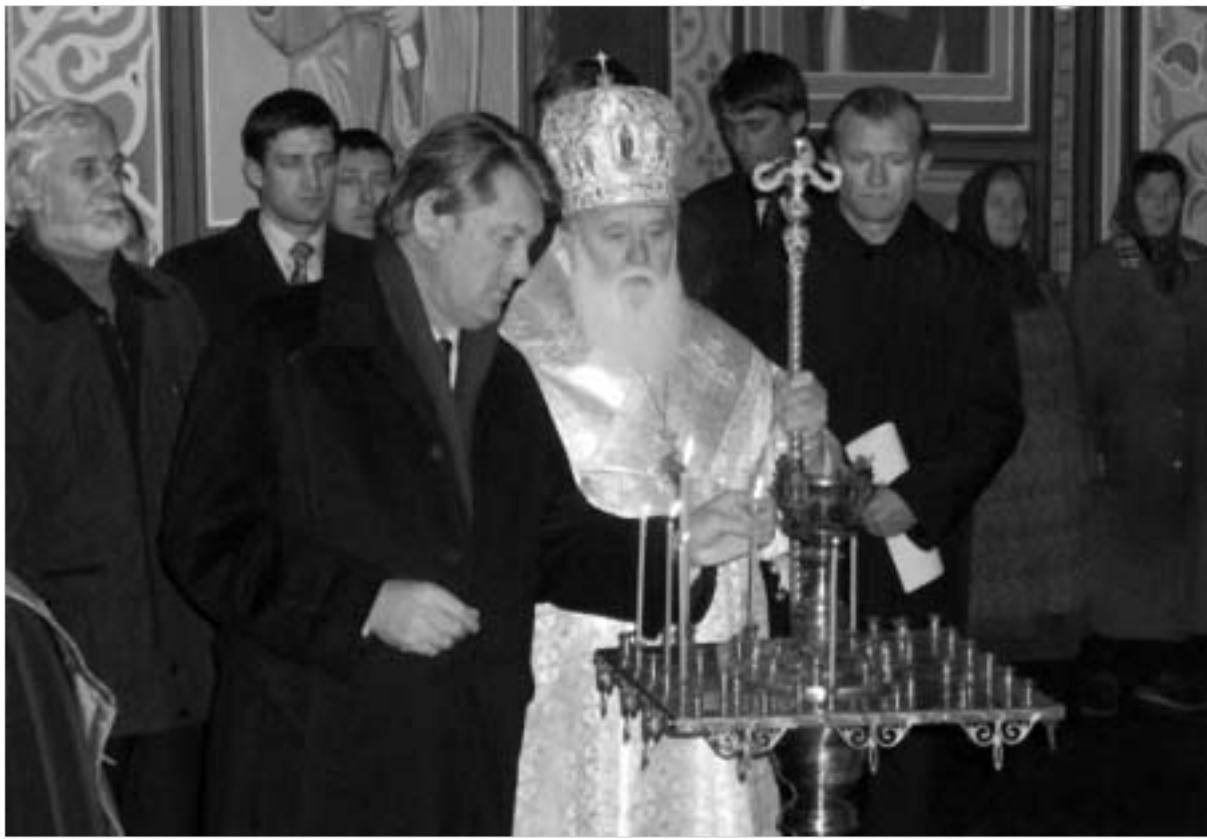
უწმინდესი ფილარქი და პრეზიდენტი იუშენკო.

გულწრფელად ვიმედოვნებთ, რომ თქვენი უწმინდესობის საჭეთმყარობლობის ქვეშ მყოფი საქართველოს მართლმადიდებელი ეკლესიის ძმური დახმარებით, ჩვენი ეკლესია გამოვა იმ ხელოვნური იზოლაციიდან მსოფლიო მართლმადიდებლობაში, რომელშიც იგი მოაქცია მოსკოვის საპატრიარქოს ხელმძღვანელობამ. ჩვენთვის აგრეთვე ცნობილია იმ ნეგატიური ქმედებების შესახებ, რომლებსაც ახორციელებს მოსკოვის საპატრიარქო საქართველოსა და საქართველოს ეკლესიის მიმართ, აფხაზეთსა და ცხინვალის რეგიონში რელიგიური სეპარატიზმის მხარდასაჭერად. ამგვარი ქმედებები უწინააღმდეგებელია საეკლესიო კანონებს და აბსოლუტურად დაუშვებელი არიან ავტოკეფალურ ეკლესიებს შორის ურთიერთობებში. მოძმე ქართველი ერის წარმომადგენლების - საქართველოს ეკლესიის სასულიერო პირების,