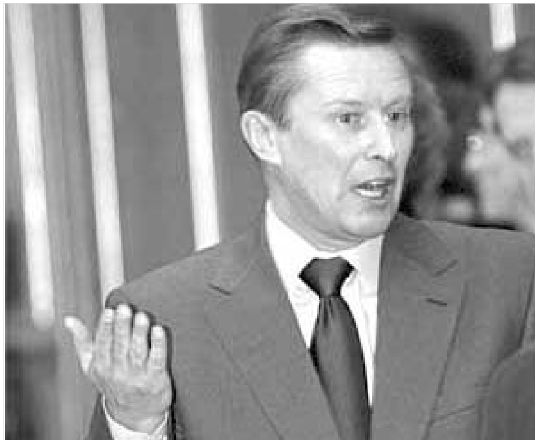
ივანოვის მკაცრ განცხადებას უმაღლესი გამოცხადებულა უკრაინული მხარე.