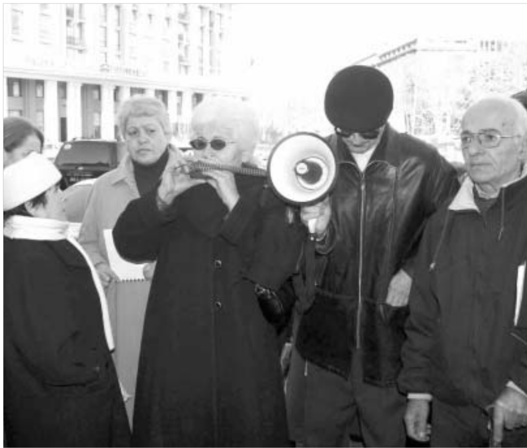
მიწისძვრით დაზარალებულთა აქცია მერიის შენობასთან.