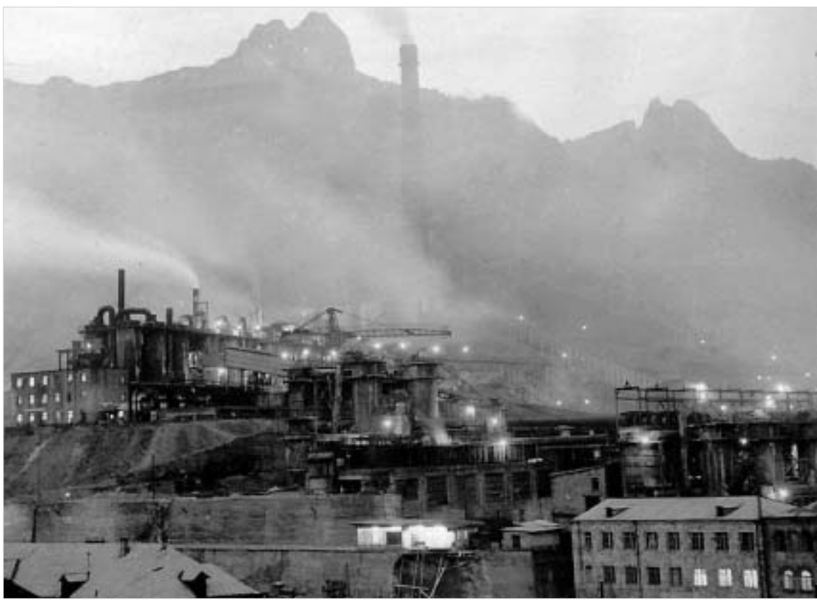
ეს ფოტო გასული საუკუნის 80-იან წლებშია გადაღებული. მას შემდეგ ქალაქ ალავერდში არაფერი შეცვლილა

გარემოს დაცვის სამინისტროში დადასტურებენ, რომ ალავერდის სანარჩოს მავნე ნივთიერებების გამოყოფის დონე დასაშვებ სტანდარტებს აღემატება.