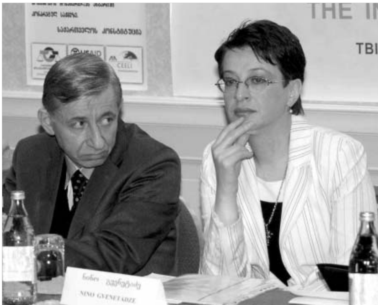
მოსამართლეები იუსტიციის საბჭოს კოლეგიის გადაწყვეტილების გასაჩივრებას უახლოეს ხანში გეგმავენ.