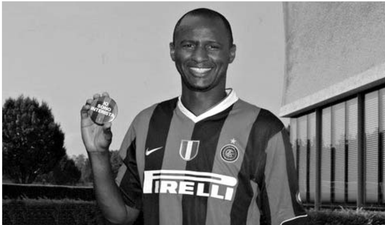
ვიერიამ "ინტერის" მისიური მორეკი.

- თქვენ პირველი ფრანგი ხართ, ვისთანაც მსოფლიო ჩემპიონატის შემდეგ გვიწვს საუბარი. რას იტყვით ფინალში მომხდარ ინციდენტზე? მატარასი ხომ ახლა თქვენს თავანუდელია... ზიდანთან ხომ არ გისაუბრიათ? და თუ ისაუბრეთ, რა გითხრიათ?