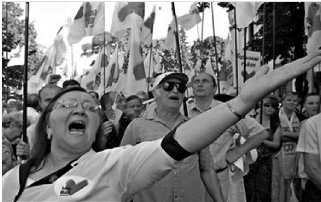
ილია ტომოშენკო რადიკალურ ოპოზიციაში გადადის.

დღეს უკრაინის უმაღლესი რადა ისტორიულ სხდომას ჩაატარებს. განხილული იქნება ვიქტორ იანუკოვიჩის კანდიდატურა ქვეყნის პრემიერ-მინისტრის პოსტზე. იანუკოვიჩს 226 დეპუტატის მხარდაჭერა სჭირდება, რაც მისთვის პრობლემა არ წარმოადგენს. გუშინ კი კიევი, მაინც ახალი სურათი იყო: სამოქალაქო პარტია "პორას" აქტივისტებმა კარვები დაშალეს, ფორთოხლები გაყვანილეს და ძირს დაშვებულ ნარინჯისფერ დროშებსა და მეგაფონებს შავი ლენტები შემოხვედნენ. ასე დაემშვიდობა უკრაინა "ნარინჯისფერი რევოლუციის" სიმბოლოებს. სწორედ "შაიდანის იდეების" ლაღატად აფასებს უკრაინული საზოგადოების ნაწილი იანუკოვიჩის დასახელებას უკრაინის პრემიერ-მინისტრის პოსტზე.