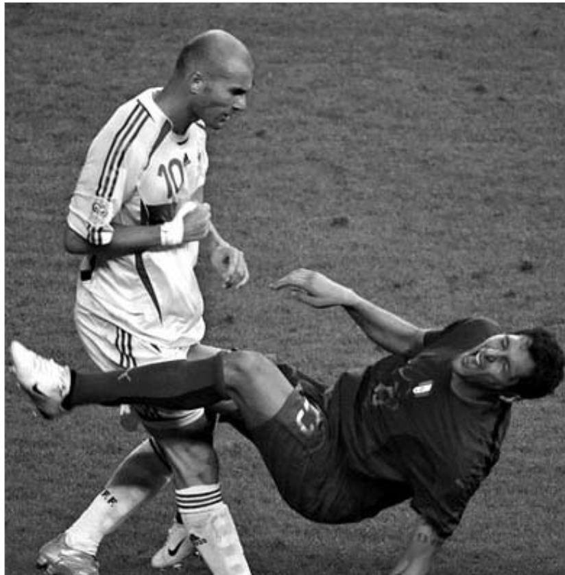
ზიდანი ეს დარტყმა კიდევ დიდხანს ემასხორებათ.

ბიზნესმენის განცხადებით, ასეთი ტიპის სავაჭრო მარკის დაპატენტების იდეა მას ფინალური მატჩიდან რამდენიმე დღეში მოუვიდა და მიხვდა, რომ ოქროს საბადო აღმოაჩინა.