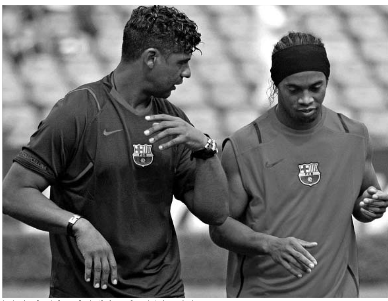
ბერლუსკონი რონალდინიოს 12 მილიონ ევროს სთავაზობდა.

ამ რამდენიმე დღის წინ გავრცელდა ინფორმაცია, რომ იტალიურ "მილანს" "ბარსელონას" ბრაზილიელი სუპერვარსკვლავის რონალდინიოს შეძენა სურდა. სიღვიბურულსკონი იმდენად იყო მოზადინებული, რომ ფეხბურთელში 100 მილიონ ევროსაც კი იხდიდა, თუმცა, როგორც ირკვევა, მთავარი ეს არ ყოფილა. იმისთვის, რომ იტალიელებს რონალდინიო გადაებირებინათ, ბერლუსკონი ბრაზილიელს "მილანში" გატარებულ ყოველ სეზონში 12 მილიონ ევროს უხდიდა ხელფასის სახით, კონტრაქტის ხანგრძლივობა კი თავად ფეხბურთელს უნდა განესაზღვრა. ფაქტობრივად, რონალდინიოს ასტრონომიულ ხელფასს სთავაზობენ, თუმცა ბრაზილიელმა მაინც არ ისურვა "მილანში" გადასვლა. საქმე ისაა, რომ ყველაფერი უკვე თავად რონალდინიოზე იყო დამოკიდებული, რადგან კონტრაქტში, რომელიც მას "ბარსელონასთან" აკავშირებს, არსებობს პუნქტი, რომლის თანახმადაც, თუ რომელიმე გუნდი 100 მილიონ ევროს გადაიხდის, რონალდინიოს წაყვანა "ბარსელონას" თანხმობის გარეშეც შეუძლია, თუ, რა თქმა უნდა, თავად ფეხბურთელს ენდობება კატალონიური კლუბის დატოვება.