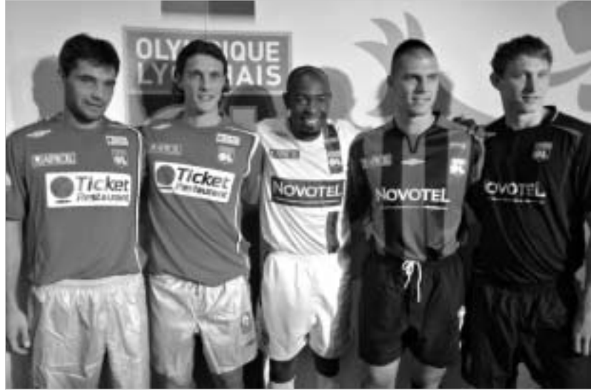
"ლიონის" ფეხბურთელები გუნდის ახალ მისურებში.

საფეხბურთო ევროპა ახალი სეზონისთვის ემზადება. ბევრი კონტინენტის ქვეყნები ეროვნული ჩემპიონატის გახურების მოლოდინში არიან. დიდი ევროპული ხუთეულიდან, ტრადიციულად, სტარტს პირველი აიღებს საფრანგეთი, რომლის ჩემპიონის ტიტულს ავირ უკვე ხუთი წელია "ლიონი" ატარებს. საფრანგეთში იმედოვნებენ, რომ წლეულს ეს ტრადიცია დარღვევა და წყარა უღივს "ლიონს" სხვა რომელიმე ნამყვენი კლუბი აჯობებს. ჩემპიონობის ამბიცია კი ფრანგულ საფეხბურთო ელიტაში თითზე წამოსათვლელ კლუბებს აქვთ. მათ შორის, ცხადია, "ლიონსაც". ბოლო ხუთი წლის ჩემპიონი, ექვგარემა, წლეულსაც მთავარი ფავორიტი იქნება. ისედაც ძლიერი ფეხბურთელებით დაკომპლექტებულმა, "რენიდან" შედი ნახევარმცველი კიმ კლუსტროში და ფრანგი მცველი სებასტიან სკილარი დაიბაძა. თუმცა, როგორც თავად "ლიონის" ხელმძღვანელობა აცხადებს, კლუბის მთავარი მიზანი წლეულს ჩემპიონობის მოგება იქნება. თუ ბოლო წლებში "ლიონს" საერთაშორისო არენაზე ასპარეზობას გავიხსენებთ, საფრანგეთის მართლაც რეალური პრეტენდენტები ჰყავს, რომელსაც ევროპის ყველაზე პრესტიჟული ჯილდოს მოგება შეუძლია. იმპი, რომ "ლიონი" წელს შეექცეოდ იზეიმებს ქვეყნის ჩემპიონობას, არც