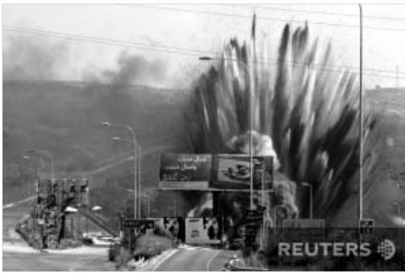
ისრაელი, როგორც ჩანს, უკან დახევას არ აპირებს.

ისლამური ქვეყნების ლიდერები მალაიზიაში გუმინ შეიკრიბნენ. მუხიდერას ლიბანის, სირიის, ირანის, ევროდანისა და სხვა ისლამური ქვეყნების წარმომადგენლები ესწრებოდნენ. მუხიდერის მიზანი ახალი აღმოსავლეთის რეგიონში შექმნილი რეალი ვითარების შესახებ მსჯელობა იყო. ლიბანურმა მხარემ მუხიდერის მონაწილეებს მოუწოდებდა შექმნილ საერთაშორისო სავაჭრო ბოკოშისა, რომელიც ისრაელის მიერ წარმოადგენდა დასაშვალ შეინაველის. ისლამური ქვეყნების ლიდერებს ირანის პრეზიდენტმა მაჰმუდ აჰმადინეჯადმა მიმართა, რომელმაც განაცხადა, რომ ლიბანის სამხრეთ ნაწილში დანეყბული კონფლიქტი მხოლოდ "სიონისტური რეჟიმის განადგურებით" თუ დასრულდება. თუმცა, მიმართვაში ირანის ისლამური რესპუბლიკის ლიდერმა ისიც აღნიშნა, რომ მანამდე აუცილებელია ცეცხლის შეწყვეტა.