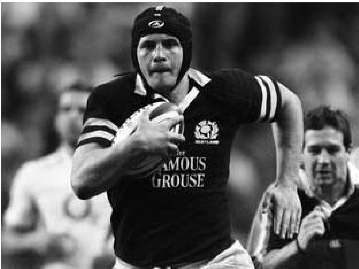
აფრიკელი "ქრუკები" "ოზების" დასამარცხებლად ემზადებიან.

შედგა რიტუალის პრემიერა, აფრიკა კმაყოფილი დარჩა, რომ მომდღეირდებოდა და ოლ ბლეკს ისევ ვეტოქებით, ავგურ, ზელანდიამ რარიგ დაგვაფასაო.