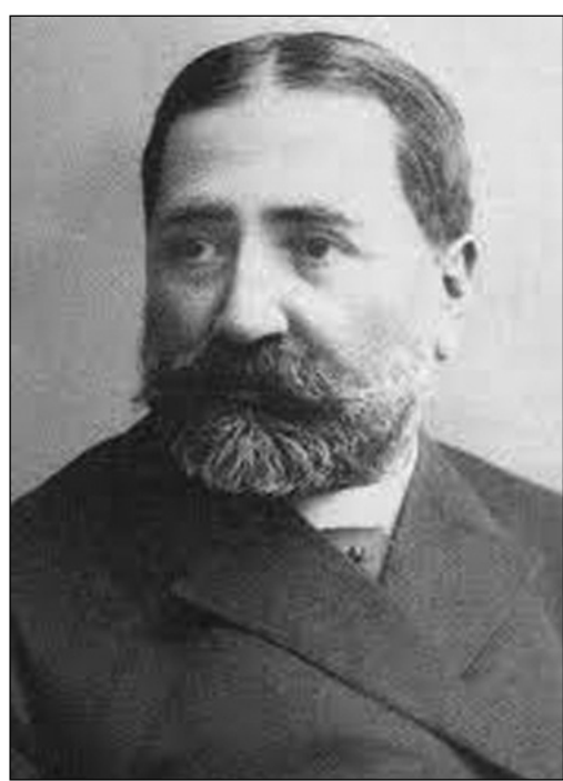
გამოუთქვამთ, კომპოზიტორი არ მოგვეპოებაო.

— არა, კაცო, იქნება მამაშენისაგან ვაგიფონია, ილია და მამაშენი ხომ დიდიხნის მგობრები არიან. იქნება, უთქვამთ რამე ქართული - ოპერის შესახებ. ილია უთხრა, რომ როგორც ვიცი, ილიას და მამაშენს ჰქონათ ლაპარაკი ქართული ოპერის შესახებ, ორივეს მწუხარება